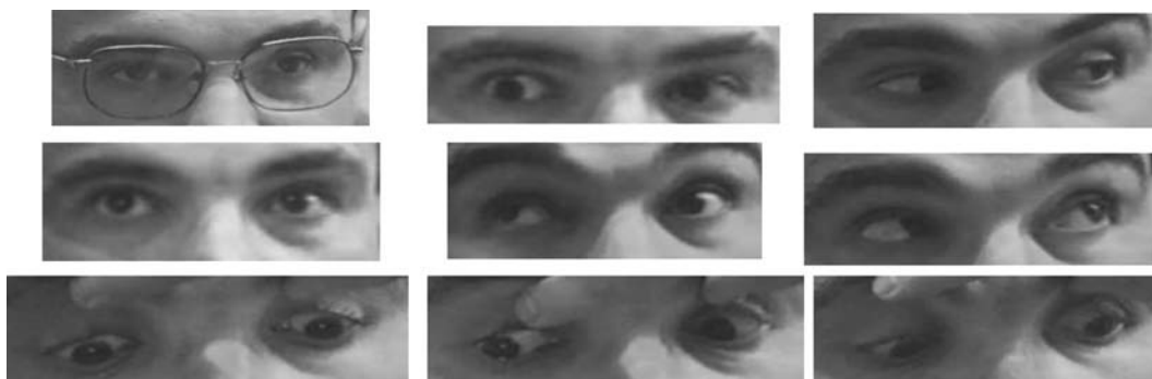
Fig. 1: Se aprecia claramente el S. Brown de ojo izquierdo.

acude a nuestra consulta dos días a la semana durante una hora diaria. Realiza ejercicios ortópticos con sinoptóforo, estereoscopios tipo Whetstone y Brewster, láminas vectográficas y regla de apertura de Vodnoy.