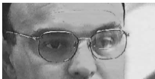
Fig. 2: Paciente con prisma de Fresnell de 8 Dp base superior en sección delante de ojo izquierdo. El paciente es capaz de fusionar en PPM, pero percibe diplopía en versiones laterales y verticales.

Los ejercicios vergenciales desarrollan las vergencias fusionales horizontales, verticales y torsionales, compensando el paciente la desviación trópica mediante movimientos fusionales.