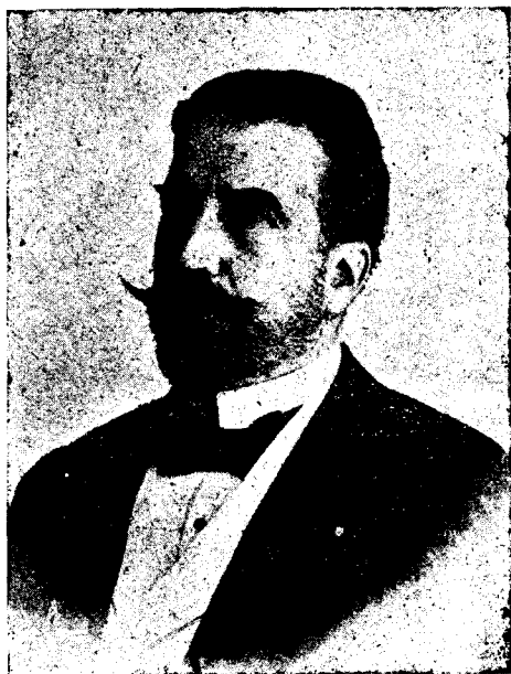
D. Manuel de Ossuna y van-den-Heede

El Regionalismo en las Islas Canarias , dos tomos, el primero impreso en 1904 y el segundo en 1916; Consideraciones sobre el fundamento del Derecho y la Ciencia Política , publicada la primera edición en 1874 y la segunda en 1916; La Inscripción de Anaga , publicada en 1889; El Problema de Canarias , aclaraciones históricas, impreso en 1911; Cultura social de Canarias en los reinados de Carlos III y Carlos IV , publicada en 1914; Impresiones de viajes e investigaciones científicas , editada en 1912; Discurso sobre las distintas fases por que ha pasado el globo terrestre, desde su lejano origen a la actualidad, determinando la aparición y desarrollo de la materia organizada y la trascendencia de los modernos descubrimientos geológicos a la Geografía y a la Filosofía de la Historia , impreso en 1886; Noticias sobre la flora y fauna de