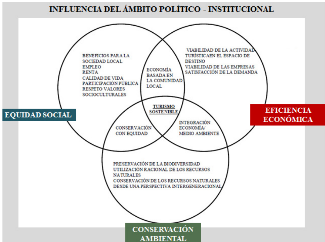
Gráfico 2: Modelo conceptual del turismo sostenible.