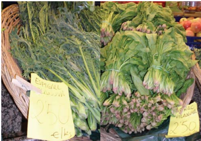
Foto 2. Productos locales vendidos en el mercado.

el pescado y el marisco fresco. La tradición y la sabiduría de los marineros, pasada de padres a hijos, ha enriquecido la gastronomía con platos como: el hervor de atún, el ajo quemado, el rossejat, la espineta, los ranchos de pescado, sepia a la bruta, la allipebre de conejo con galeras y el plato más conocido: el xató.