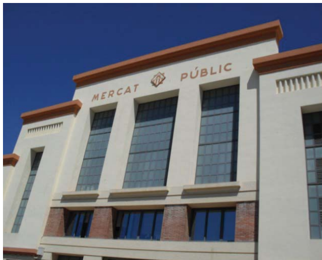
Foto 3. Mercado central de Vilanova i la Geltru.

El mercado central cuenta con un número muy superior de paradas con respecto a las 15 del mercado del mar. Cada una de éstas paradas puede ser susceptible de convertirse en un punto de promoción, degustación