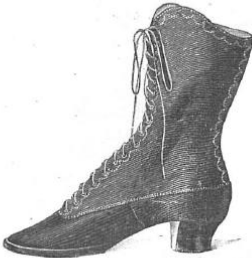
15. —Bota de paseo.

ME 22/3/1881, p. 82. Zapato inglés con un tacón híbrido entre el inglés y el Luis XV.