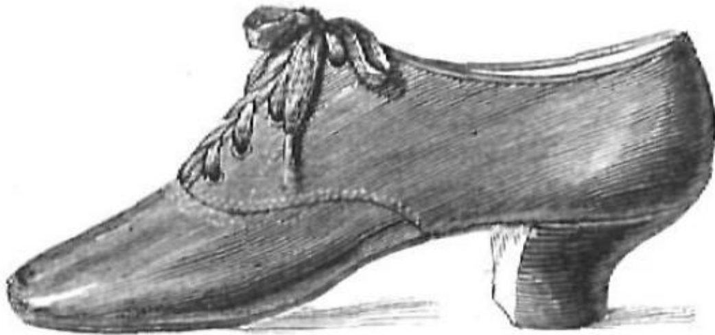
12. —Zapato inglés.

ME 22/3/1881, p. 82. Zapato inglés con un tacón híbrido entre el inglés y el Luis XV.