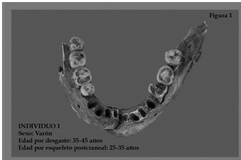
Mandíbula de varón procedente del yacimiento de Chinchero con erosión del esmalte y la dentina por una disolución de la hidroxiapatita.

grave erosión del esmalte y de la dentina al descender el Ph y disolverse la hidroxiapatita (figura 1); y por otro, ulceración, necrosis y la rápida recesión de los tejidos gingivales que culminan con la pérdida antemortem de las piezas posteriores (Villa, 1999).