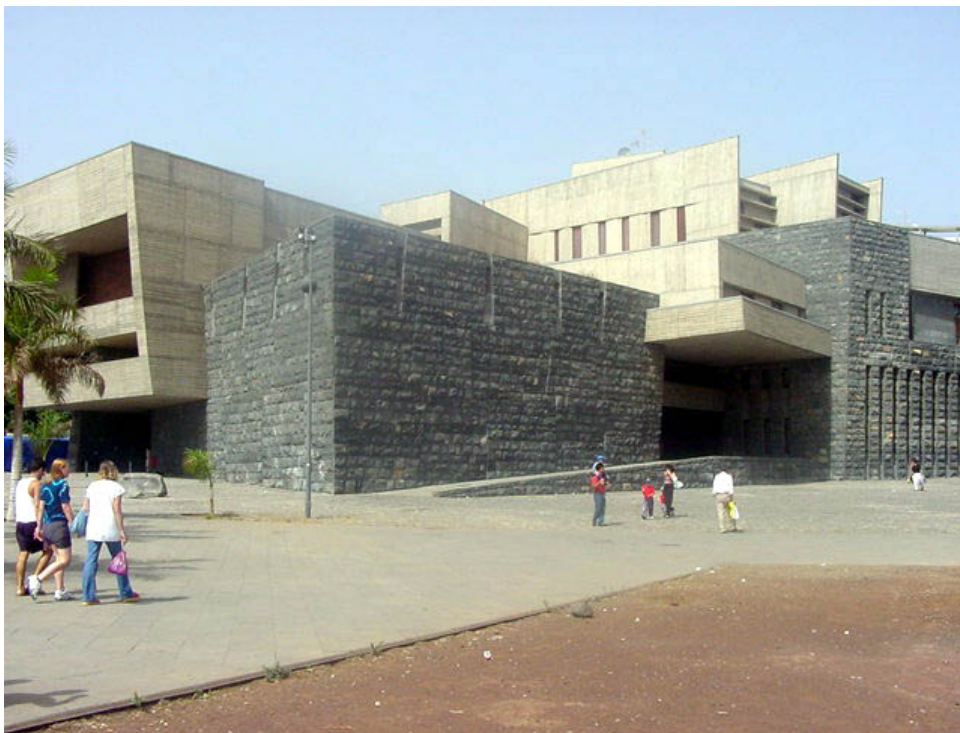
Sede de la Presidencia del Gobierno de Canarias.

El edificio se presenta como un conjunto de volúmenes de piedra alrededor del patio de la casa Halmiton, reliquia histórica reconstruida tras su desmontaje en 1973. El patio recupera su antigua función de núcleo distribuidor de la estructura del edificio. El sótano alberga el garaje. La planta baja se presenta exenta de soportes estructurales y en ella se organizan grandes espacios como la biblioteca y el salón de actos. La primera planta se reserva a los usos administrativos encontrándose en ella estancias como el Gabinete de la Presidencia y la Secretaría General Técnica. La planta segunda se reserva para los Actos Protocolarios e Institucionales, el Salón de Recepciones, directamente comunicado con el núcleo central del edificio que se prolonga en un patio arbolado sobre el salón de actos y las salas de gobierno miran hacia el macizo de Anaga. Por último, sobre la cubierta ajardinada se ubican las dependencias privadas. Aportación significativa de Artengo, Menis y Pastrana fue dotar a cada espacio de un carácter propio mediante el uso de la luz, el color y la textura de las diferentes piedras (piedra basáltica del Guincho, piedra roja de La Gomera y piedra traquítica de Tindaya).