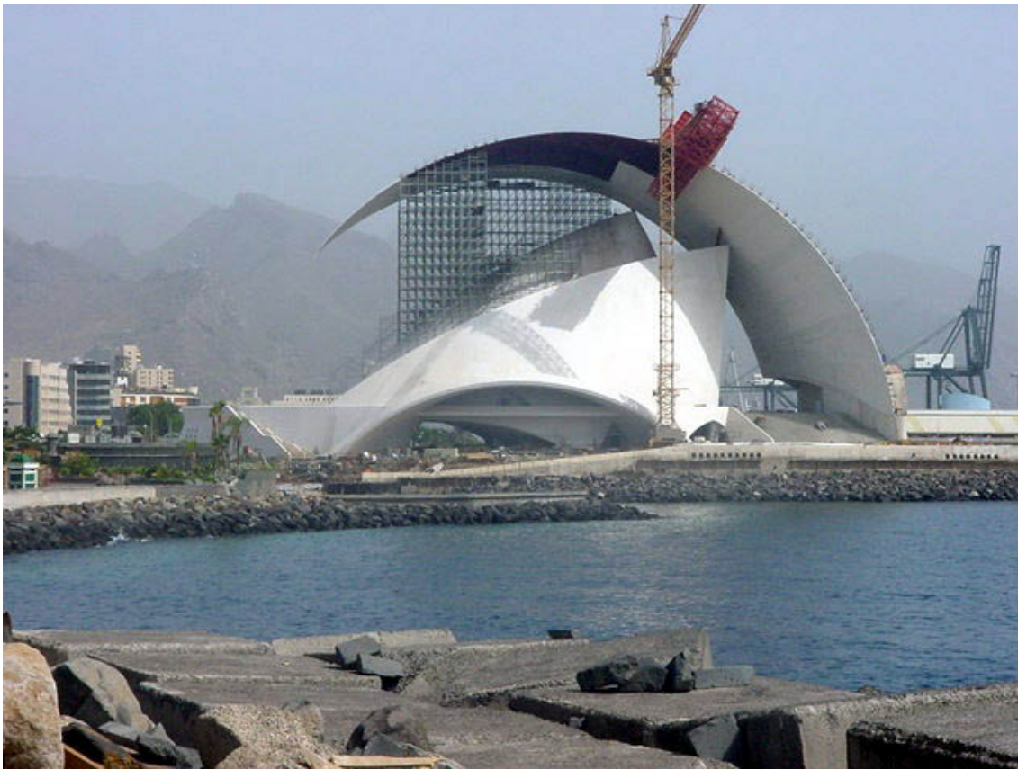
Auditorio de Santa Cruz de Tenerife.

su forma a “velas”, y por último una sobrecubierta de planta triangular, que se alza a 58 m, exenta y de fuerte expresividad reconocida como “ala”.