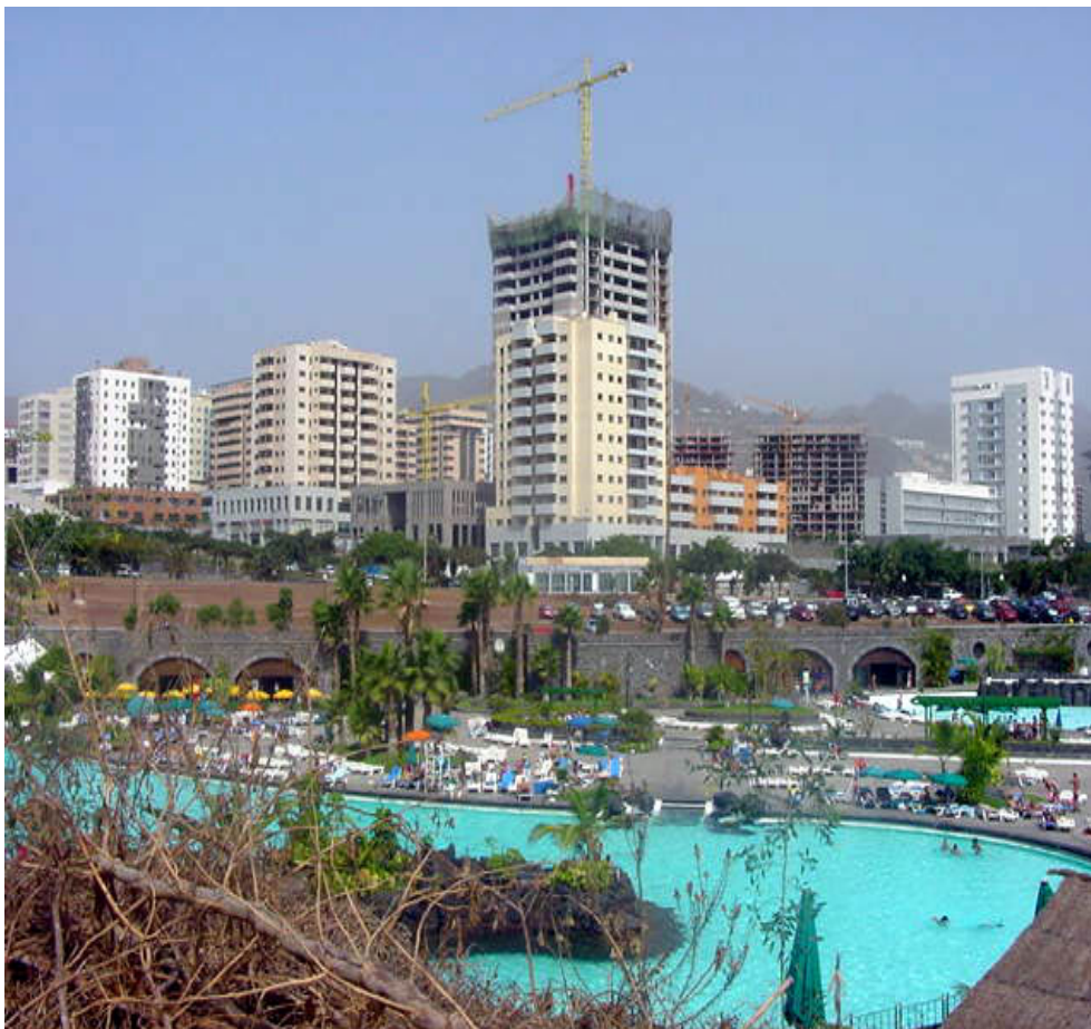
Vista de Cabo Llanos en el 2002.