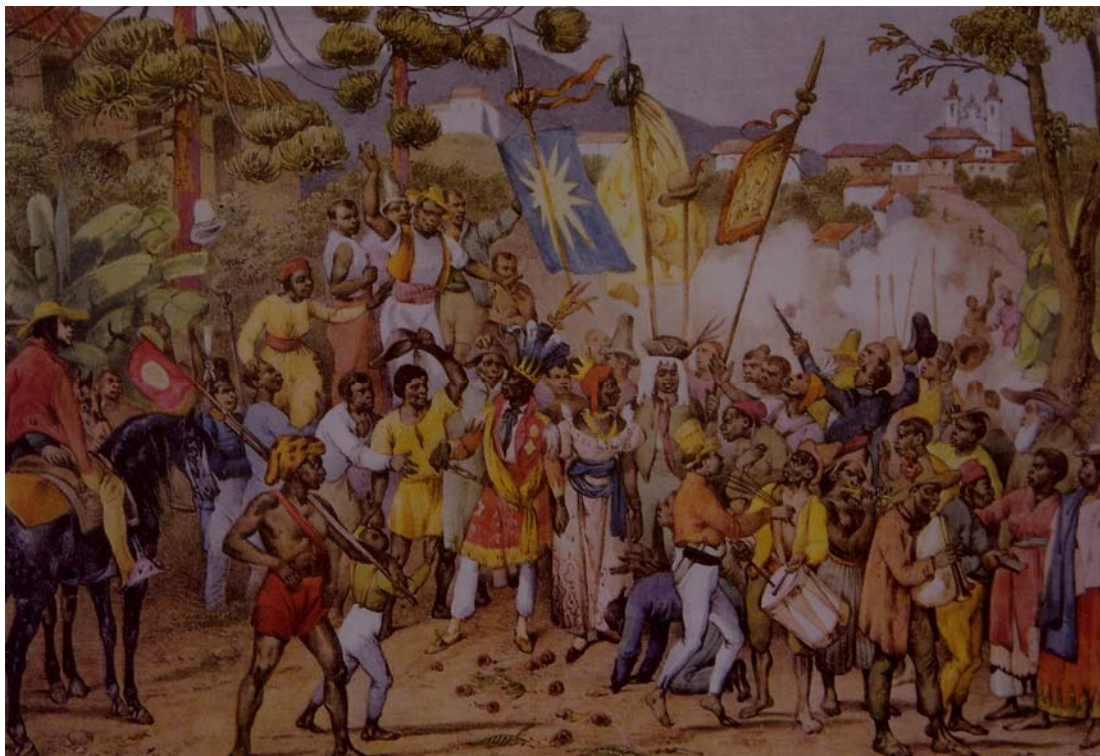
Figura 4. Fête de Ste. Rosalie, patronne des Nègres. Litografía de Johann Moritz Rugendas hacia 1835 publicada en Voyage Pittoresque dans le Brésil (4 a división, plancha 19).

La conclusión que puede extraerse tanto de la lectura libro de Rugendas como de las ilustraciones que realizó para su preparación no dejan dudas sobre el interés por destacar el papel social tan importante que el negro juega en la sociedad brasileña, casi, y según se desprende de las imágenes, en igualdad de condiciones con el blanco, algo muy alejado de la realidad. Naturalmente, Rugendas une al hecho de ser un pintor costumbrista el traslucir en su obra un ideal filosófico sobre los derechos de los esclavos, muy lejanos aún de ser alcanzados. No obstante, sí nos parece significativo que conceda tanta importancia a la mujer, y en especial a la negra, algo que nunca antes había sucedido en la historia de Brasil puesto que las escasas referencias plásticas que conocemos, por ejemplo en el caso del retato, abordan la imagen de la mujer blanca.