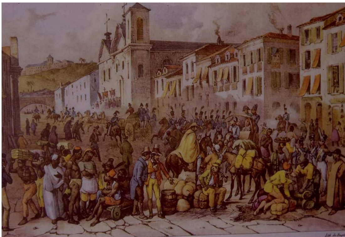
Figura 1. Rue droite à Rio Janeiro. Litografía de Johann Moritz Rugendas hacia 1835 publicada en Voyage Pittoresque dans le Brésil (3 a división, plancha 13).

Entre los grabados del primer grupo destacamos Rue droite à Rio Janeiro (3 a división, plancha 13) donde se escenifica el ir y venir en una de las calles más bulliciosas de la corte imperial, donde las mujeres negras participan de la vida cotidiana portando sus mercancías y compartiendo la cotidianeidad con hombres blancos y negros sin señalarse necesariamente el carácter esclavo. Esta visión optimista se ve truncada por otras litografías donde se aprecia el origen esclavo pero donde la mujer no muestra sumisión, sino una actitud gallarda aún en las peores circunstancias, como en el Marché aux Nègres (4 a división, plancha 3), Blanchisseuses à Rio Janeiro (4 a división, plancha 11) donde curiosamente se incluye a una mujer blanca entre las lavanderas negras, o en la Préparation de la racine de mendioca (4 a división, plancha 7), donde la vemos como operaria que, como se ve en una de los personajes, no abandona la función del cuidado de los hijos. Particularmente negativa nos parece la idea que desea transmitir Rugendas en la Chatimens domestiques (4 a división, plancha 10), en la que dos mujeres negras, obviamente esclavas, van a ser castigadas con golpes (una es llevada por la oreja), quién sabe la razón, ante la presencia de un grupo de mujeres y hombres blancos que, indolentes, presencian la escena. Es, sin duda, un alegato antiesclavista, postura que, como vemos, no sólo dejó presente en los textos, sino que la expresó igualmente en sus grabados.