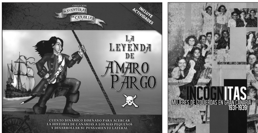
Publicaciones de LeCanarien.

puede disponer del formato papel y prefieren lo digital por cuestiones de espacio y, en cierto modo, porque supone un ahorro económico. En principio seguiremos viendo lo que pasa en el mercado. Mi opinión personal es que lo digital no será tan aniquilador. Actualmente, la televisión, la radio y el periódico conviven como medios de comunicación. Cada uno tiene su espacio; su magia. Creo que el libro, en soporte papel, difícilmente podrá ser reemplazado en el futuro y convivirá con el soporte digital.