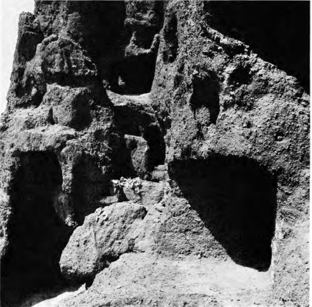
Abb. 1 Detail vom Höhlenpalast der Montana de las Cuatro Puertas (Gran Canaria)