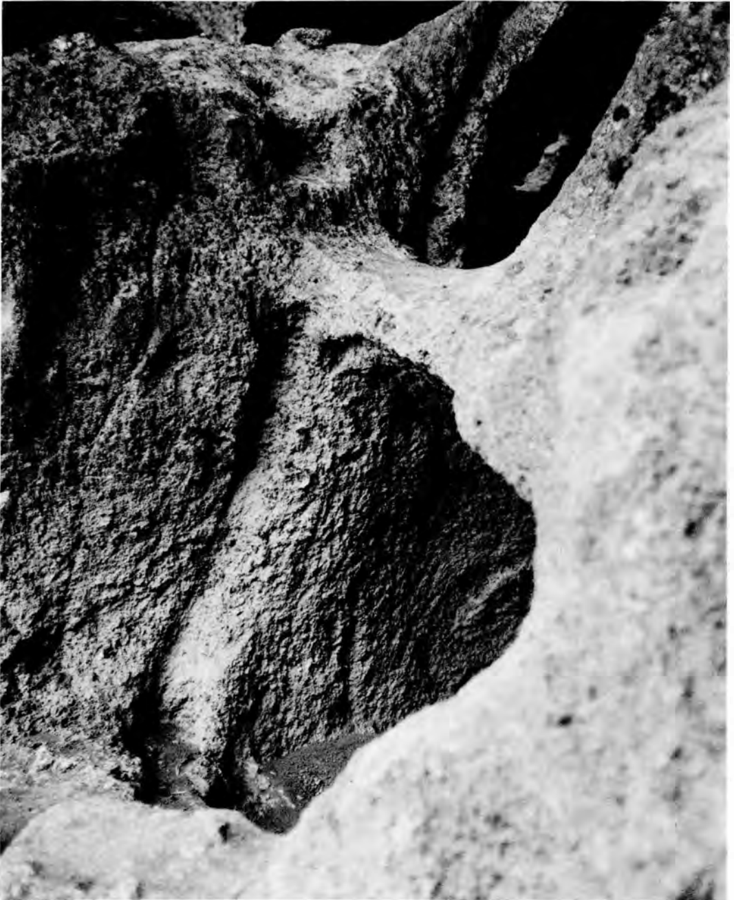
Abb. 4 Eingänge zu Höhlenkammern mit Ausnehmungen für Eingangverschlüsse