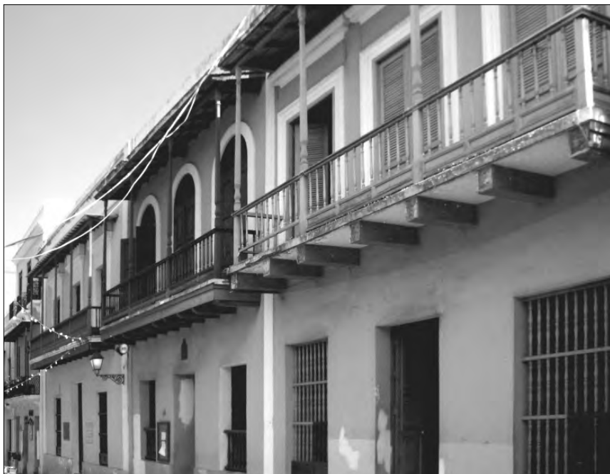
FIGURA 5: Balcones en la calle Cristo de San Juan, donde se ven los canes, cortados a escuadra, que han quedado descubiertos al desprenderse la tabica que los oculta

damos situarlo en los antepechos opacos de tablas —dispuestas en vertical— que aún se conservan en las arquitecturas montañosas del norte de España. Progresivamente, la labor estética sobre el antepecho de los balcones y solanas fue reduciendo la parte opaca al ir perfilando las tablas con diversos motivos y con la incorporación de balaustres; esto ya en épocas más recientes y en construcciones más nobles. En algún texto antiguo encontramos que el uso principal de los balcones era que las «damas nobles, y castas» 66 , pudiesen solazarse con las vistas hacia la calle. Con el fin de evitar las vistas indiscretas desde la