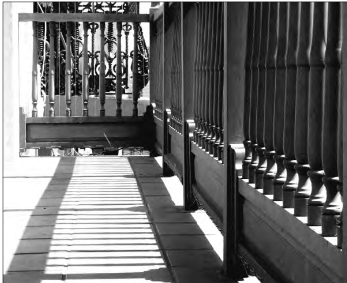
Figura 7: Tapafaldas en la calle Fortaleza de San Juan de Puerto Rico

A: La Habana (Cuba); B: Bogotá (Colombia); C: Puerto Cabello (Venezuela); D y E: Cuzco (Perú); F: Salta (Argentina); G: Santiago de Chile; H: Potosí (Bolivia); I: Lima (Perú) (elaboración propia)