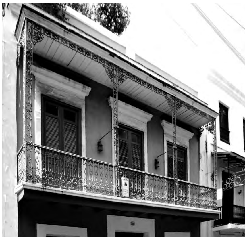
FIGURA 10: Balcón de hierro que ha sustituido a uno más antiguo de madera en la calle Cristo de San Juan. Se han conservado los canes, el suelo y el tejeroz, aunque la baranda y los pies derechos se han sustituido por elementos de hierro forjado

ciendo a favor del hierro, por sus valores de prefabricación y economía. En una primera etapa conviven ambos materiales, ya que las piezas de madera que van necesitando reparaciones se sustituyen por otras metálicas; gradualmente el balcón original ha cambiado la madera por hierro pero ha mantenido la forma. Sin embargo, en una segunda etapa los balcones ya se construyen enteramente de hierro y sus formas responden a las nuevas influencias que esta vez provienen de los Estados Unidos, Francia e Inglaterra. De esta manera gradual se termina de diluir el tipo tras cuatro siglos de permanencia en tierras americanas.