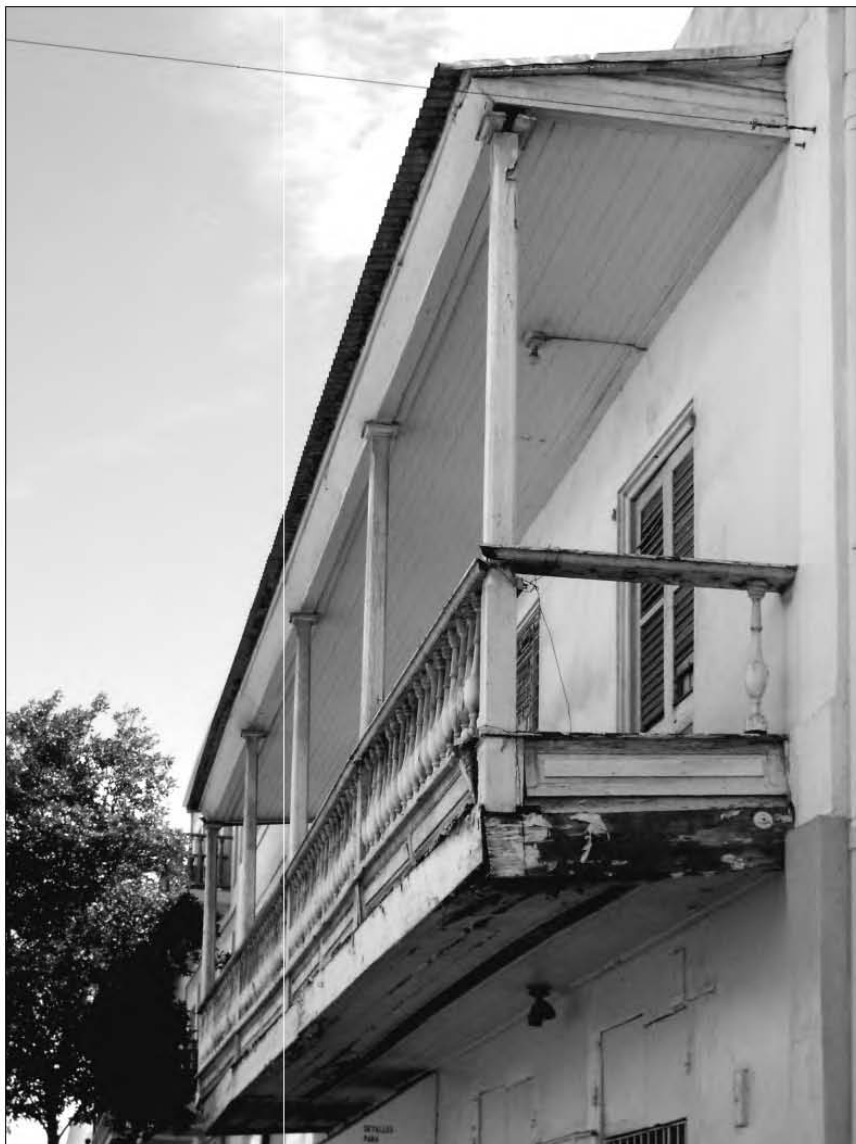
FIGURA 9: Balcón en Ponce

distintivo de la época. El edificio de la Inquisición de Cartagena de Indias, de 1770, presenta balcones corridos de 3 y cuatro