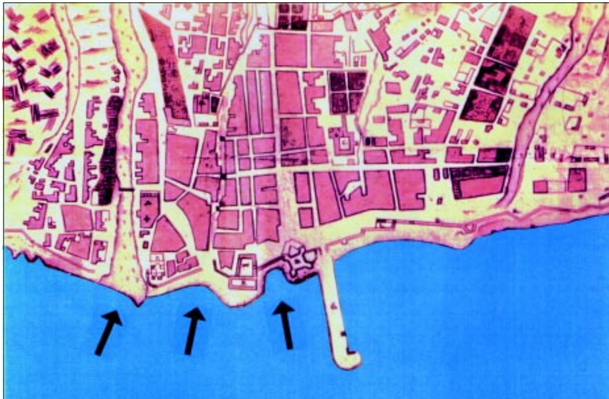
LÁMINA 3.—Los botes de la flota se perdieron de su objetivo.