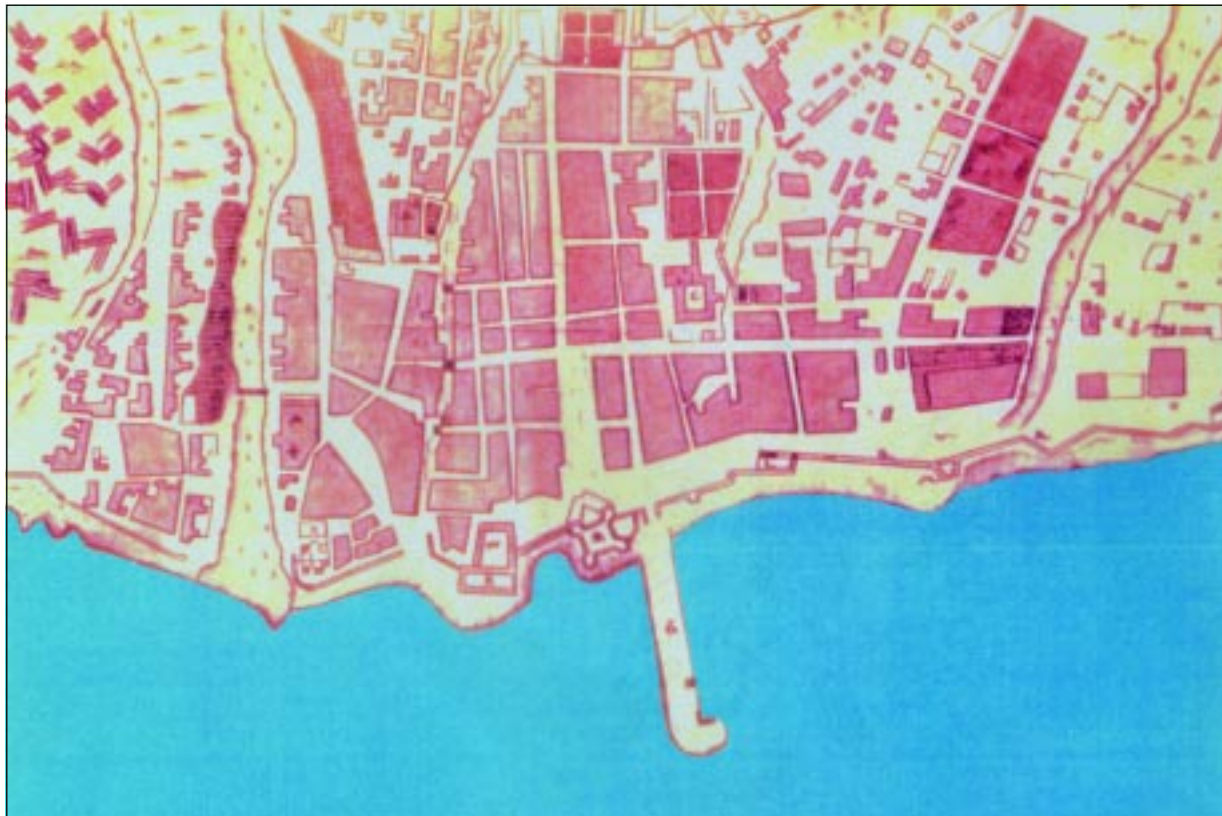
LÁMINA 1.—Santa Cruz en 1750. Por el ingeniero Hernández. En primer término, el muelle y el castillo.