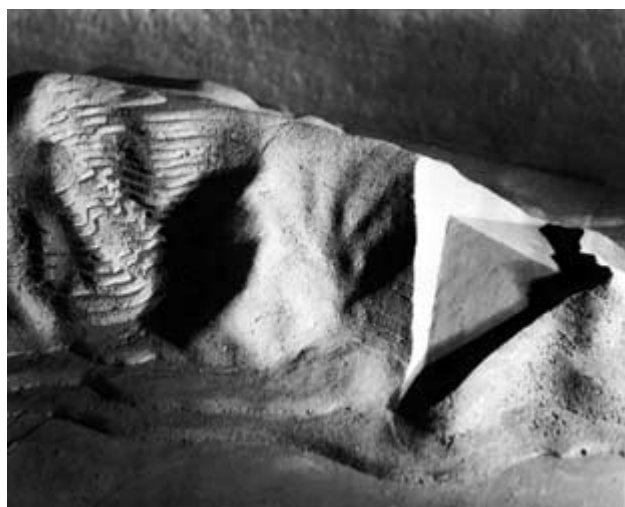
Tony Smith, maqueta de Proyecto Pieza de Montaña de 1968.

acceder a esta lógica de la construcción del lugar sin abandonar la lógica de la escultura moderna, de aquella estatuaria abstracta, autónoma y ubicua. En ella se sigue concibiendo la obra, pese a la pérdida del ilusionismo y pese a la literalidad con que expresa material y formalmente su propio medio, como una entidad individual dotada de interioridad. Ya vimos cómo aquella polémica que Fried supo articular en torno al concepto de teatro vendría a ser una dramatización de la pugna entre dos voluntades del arte actual: la de interioridad y la de exterioridad. Y cómo la frontera entre una y otra sólo resultaba perceptible hoy por su diferente temporalidad: la que desea representar la totalidad en el instante o, por el contrario, la que desea hacerlo mediante el fragmento de una duración infinita. Dos opciones posibles, por tanto, la de reservarse un tiempo dentro o la de someterse al tiempo de fuera , una división que se acomoda a la perfección con la dialéctica de la experiencia urbana en la modernidad: vida privada, vida pública. Por mi parte, no estoy muy seguro de que una de estas opciones sea más legítima que la otra. En tiempos difíciles cada cual es libre de elegir qué camino seguir para realizar su vida o su obra. Mi intención en el presente texto no es la de deslegitimar a quienes optan en el arte por lo privado, sino exclusivamente la de constatar el peligro que entraña confundir, también en arte, lo público con lo privado.