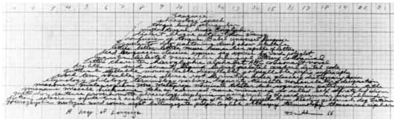
Robert Smithson, Amontonamiento de lenguaje , 1966. Lápiz sobre papel, 16,5 x 55,9 cm.

escultóricas se enfrentan al espectador como una unidad orgánica cerrada, sólida y hermética, con temporalidad interior, y en ellas se pretende dar expresión a algo privado e individual contenido en su formas, no al espacio público como tal. Su resolución formal viene determinada por la dialéctica de lo vacío y lo lleno: vacía o sustrae parte de la masa provocando rupturas o intersticios en lo lleno, logrando de esa manera modular mediante vanos la forma del bulto. Esta descripción resulta especialmente válida para sus obras en piedra, como es el caso de los alabastros que preludian su intervención en la montaña, Mendi Hutz -Vacío en la Montaña- , de 1984 y Elogio de la luz XX , de 1990: “En ambas piezas intenta Chillida penetrar la piedra, creando un espacio en su interior al sacar la materia” [46]. También en Tindaya, en efecto, se penetra la montaña para crear mediante el vaciado un espacio interior. Debemos deducir, por tanto, que en este proyecto se trata a la montaña como si fuera un bulto escultórico, como si fuera esa masa que el plástico moderno modula con sus manos. Pero una roca no es una montaña. Es más, pertenecen a distintos órdenes como lo demuestra el que la montaña sea el lugar donde se encuentran las rocas. La cuestión que cabe plantear, entonces, es si se está haciendo lo mismo cuando se penetra o vacía una roca y cuando se hace en una montaña. Considero que sería un error de bulto confundir una operación con otra.