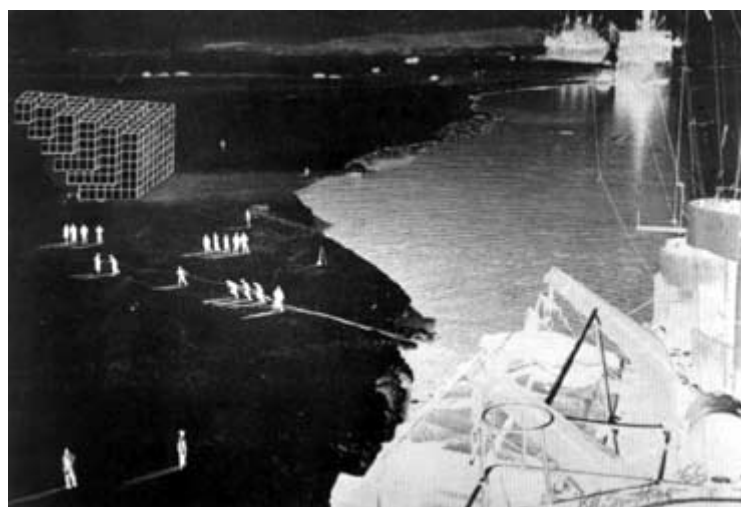
Robert Smithson, Sin título ( paisaje de Ciencia Ficción ), 1966. Fotostato, 21,6x 30,5 cm.

Aceptar ese proceso, asumir que se está trabajando en “el nuevo paisaje de abstracción y arteficio”, obliga a abandonar la representación frontal, in visu sea pictórica o escultórica- por una representación situacional, in situ . Entendida aquí como configuradora del lugar, pero no en un sentido propiamente arquitectónico, no como un envase espacial cerrado para conformar habitación, sino en un sentido similar al que ha desarrollado la teoría contemporánea del jardín, como una representación plástica del paisaje en el lugar. Con la salvedad, lo hemos visto, de que el arte del suelo nace de la radical desubicación tanto de la escultura como del lugar natural, de modo que lo único que aquí se acertaría a representar in situ sería la imagen de un paisaje sin naturaleza : “Los jardines de la historia están siendo reemplazados por los solares del tiempo”.