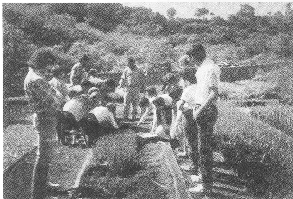
Alumnos haciendo prácticas en el vivero del Jardín Canario.

Fomentar el debate sobre objeto, fines y situación actual de la E.A. en Canarias.