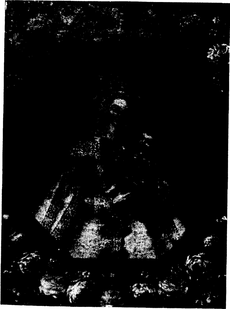
Virgen del Pino. Óleo en la parroquia de San Francisco de Las Palmas