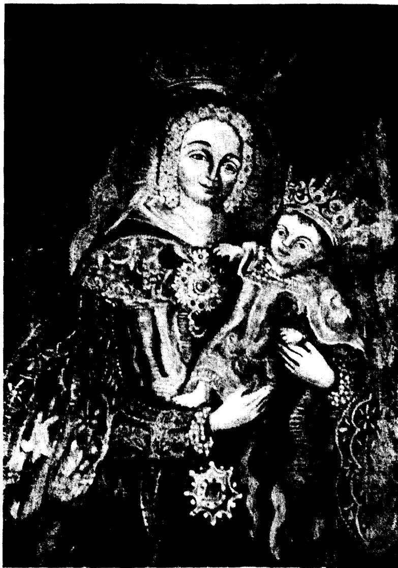
Virgen del Pino.—Óleo de propiedad particular. Copia del existente en San Francisco