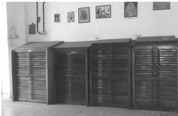
Imprenta Acción Social.

agosto de 1933, la Imprenta Acción Social sufrió un ataque vandálico en su sede de la calle Hermenegildo Rodríguez Méndez por parte de simpatizantes de partidos de izquierda; la maquinaria fue rota a martillazos y parte del equipo fue arrojado por el risco de La Luz. El periódico se demoró más de un mes volver a ser publicado.