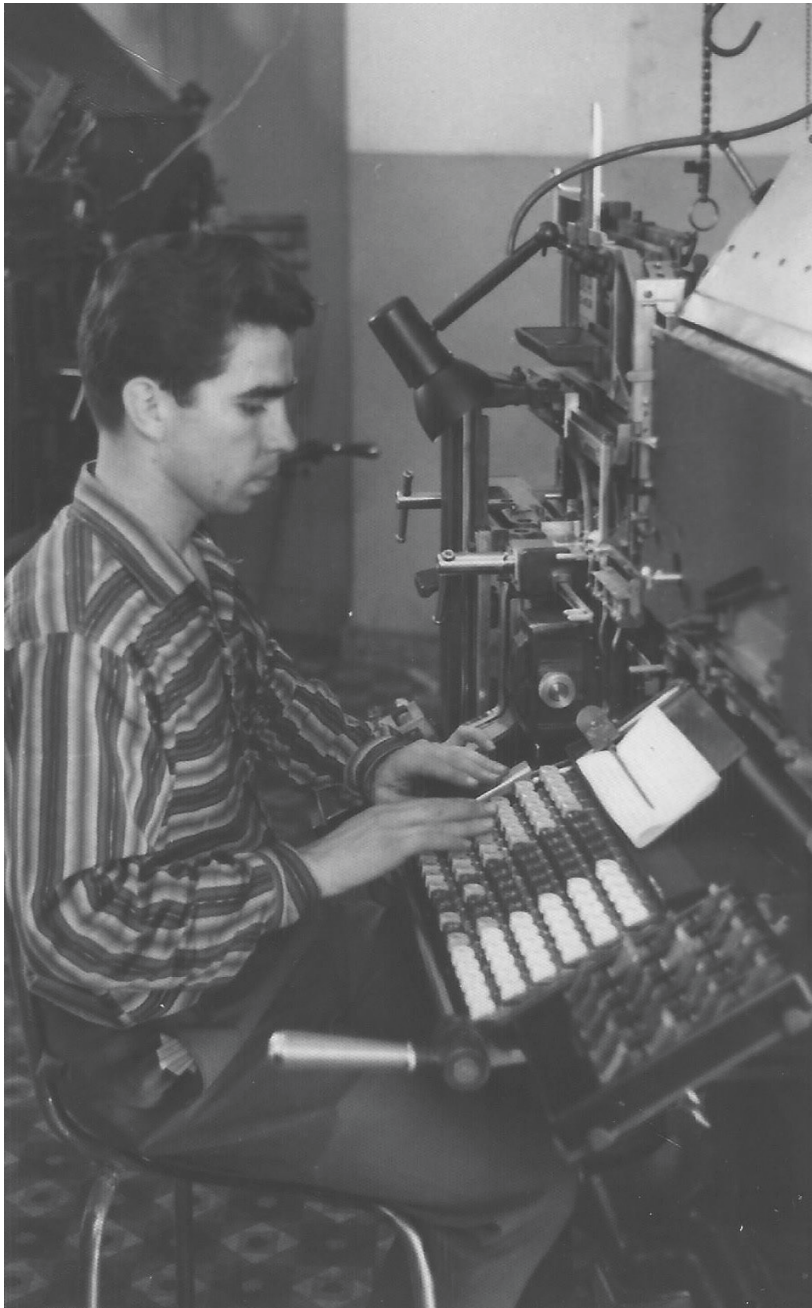
Imprenta Diario de Avisos.