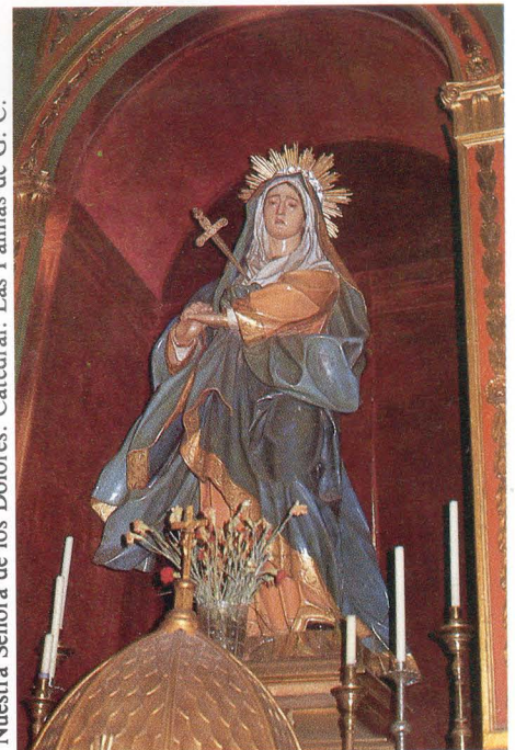
Nuestra Señora de los Dolores. Catedral. Las Palmas de G. C.