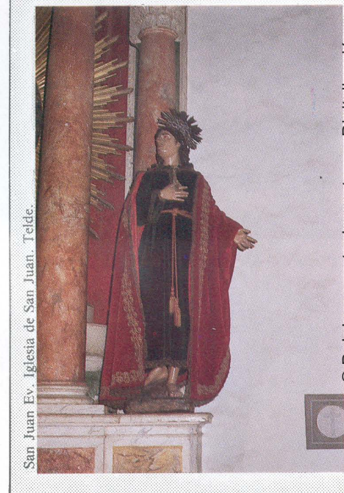
San Juan Ev. Iglesia de San Juan, Telde.

En el tema de los santos también se muestra Luján con toda la retórica del barroco. En el San José de la Catedral de Las Palmas toma la base de nubes con angelotes, tal como realizara para algunas imágenes de la Virgen; sin embargo no es frecuente esta solu-