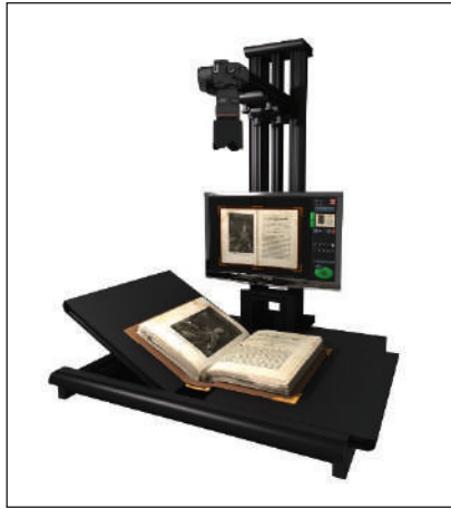
Escáner de libros.

planos, escáneres de microfilm, escáneres para digitalización en 3D, cámaras fotográficas, reproductores de casete o pletinas, reproductores de cartuchos, magnetófonos, tocadiscos, conversores analógico-digital de audio o video, etcétera.