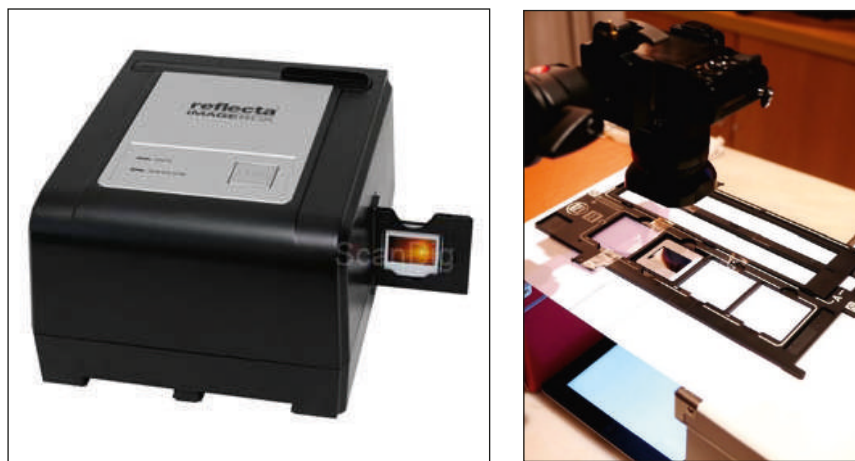
Digitalización de diapositivas.

Más concretamente, los metadatos que pueden y suelen asociarse a las obras de las bibliotecas digitales serían de los siguientes tipos: