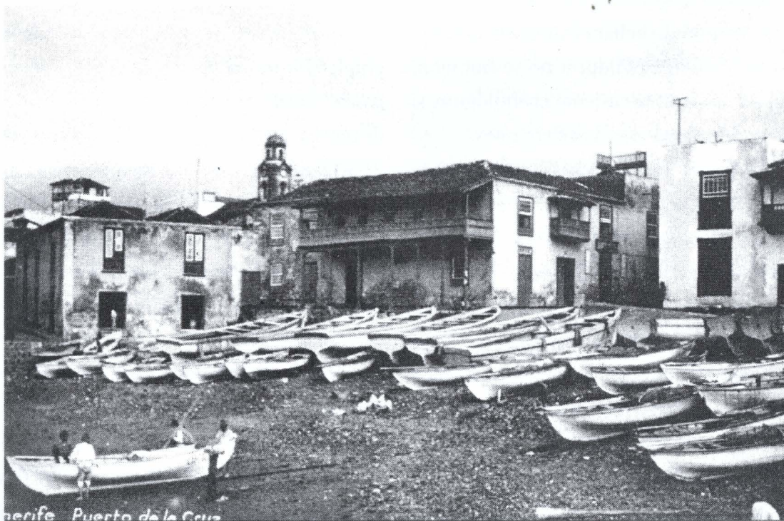
Muelle del Puerto de la Cruz

muy seriamente una visita a la isla y, a tal fin, se pone en contacto con un marino de Londres. Pero Darwin no realizará ese viaje proyectado debido a su compromiso para participar en un viaje alrededor del mundo, a bordo del HMS Beagle , entre el mes de diciembre de 1831 y octubre de 1836. Viaje que le llevará a la publicación de su célebre libro El origen de las especies . La participación de Darwin en el largo periplo será consecuencia de la concurrencia de varias circunstancias: su amigo el profesor Henslow le puso en contacto con el capitán FitzRoy que buscaba un naturalista joven que le acompañase en el proyectado viaje. El tío de Darwin persuade al padre de su sobrino para que permita a éste embarcar; FitzRoy le confesará más tarde a Darwin que estuvo a punto de no aceptarle a causa del perfil de su nariz que, conforme a las teorías del suizo Jean-Gaspard Lavater era testimonio de una absoluta falta de energía y fuerza de voluntad. El 6 de Enero de 1832 el Beagle se dispone a atracar en Tenerife,