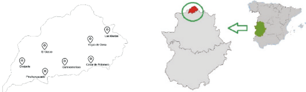
Figura 1 y Figura 2: Localización de la comarca de Las Hurdes y situación de las localidades donde se sitúan los restaurantes que han sido objeto de estudio.

Finalmente, todo este material empírico, así como el recopilado en un diario campo al efecto (Vallés, 1997; Cantero et al., 2020), ha sido analizado usando el método de comparación constante, análisis inductivo y triangulación (Denzin, 1970; Phillippi & Lauderdale, 2018), articulándose a partir de la reflexividad refleja necesaria en la producción de conocimiento (Bourdieu et al., 1968).