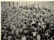
Reparto de bonos de comida en el Puerto de La Luz

La Primera Guerra Mundial (1914-1918) además de un enorme drama humano, supone un cambio significativo en el panorama socioeconómico de la época que afecta enormemente a la producción y exhibición cinematográfica del momento.