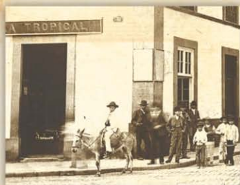
Ciudadanos de Las Palmas de Gran Canaria junto a la tabaquería LA TROPICAL (en el edificio que hoy ocupa el CICCA) lugar donde se vendían entradas para espectáculos de la época.