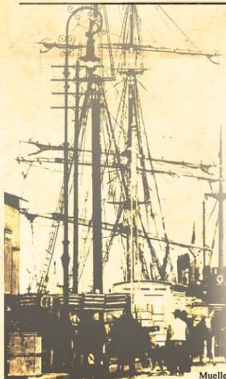
Muelle de Santa Catalina en Las Palmas de Gran Canaria

A finales del siglo XIX, los puertos canarios, como punto de paso entre continentes, son con frecuencia escala de buques y vapores en los que viajan artistas y compañías que aprovechaban esos breves períodos de tiempo para ofrecer sus espectáculos.