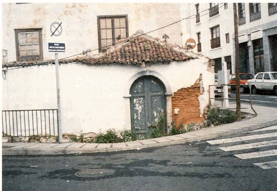
Capilla de la Cruz Verde, calle de Herradores de La Laguna.