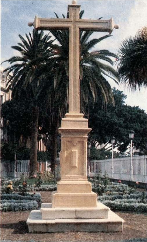
Cruz de Mármol de Montañéz, Plaza de la iglesia de la Concepción de Santa Cruz de Tenerife.

remodelación, se llevó la Cruz, por acuerdo del Ayuntamiento, a la plaza de la ermita de San Telmo, y de aquí, al variar la configuración urbanística de la zona Cabo-Llanos, se la trasladó a la plaza de la iglesia de la Concepción donde se encuentra actualmente.