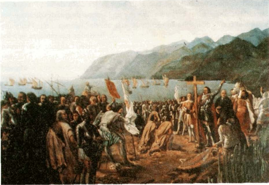
Fundación de Santa Cruz de Tenerife , obra de Gumersindo Robayna y Lazo, (Museo Municipal de Bellas Artes de Santa Cruz de Tenerife).

El cavo del madero mas cumplido hincaron en la arena, y lo adoraron; digo adoraron por lo que he sentido que devotos ante él se arrodillaron; formaron luego un escuadrón lucido, y con armas no vistas se adornaron.