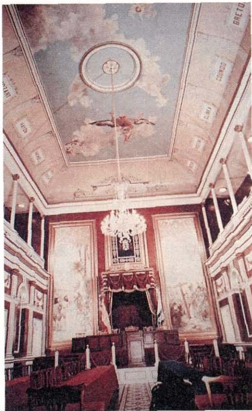
El Adelantado y los Guanches.

Se trata de un lienzo en donde con el mismo fondo que en el anterior es decir, una bahía en calma donde están fondeadas las naves, y la presencia de la de la Cordillera de Anaga, aparece un pequeño templete flanqueado por banderas y cuatro jinetes. En primer término, un grupo de caballeros a cuyo frente aparece el Adelantado. Detrás, las tropas formadas (25) . Un altar adornado con flores y hierbas olorosas, sobre el cual celebró la misa el canónigo Alonso de Samarinas, ayudado por fray Pedro de Cea y fray Andrés de Goles, religiosos agustinos, otros dos franciscanos y algunos eclesiásticos seculares (26) .