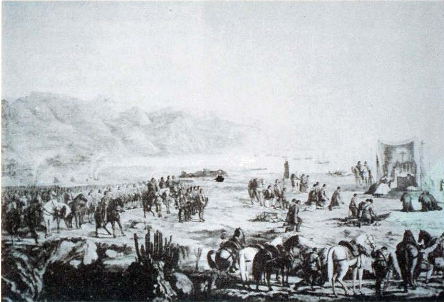
La Primera Misa en Tenerife , obra de Gumersindo Robayna y Lazo, (Museo Municipal de Bellas Artes de Santa Cruz de Tenerife).

“Passó el silencio de la noche oscura, amaneció la luz del claro día, víspera de la Santa Cruz de Mayo, celebraron la fiesta los de España, con el puerto de Anago, a quien pusieron dende aquel día el venturoso nombre de Santa Cruz...” (24).