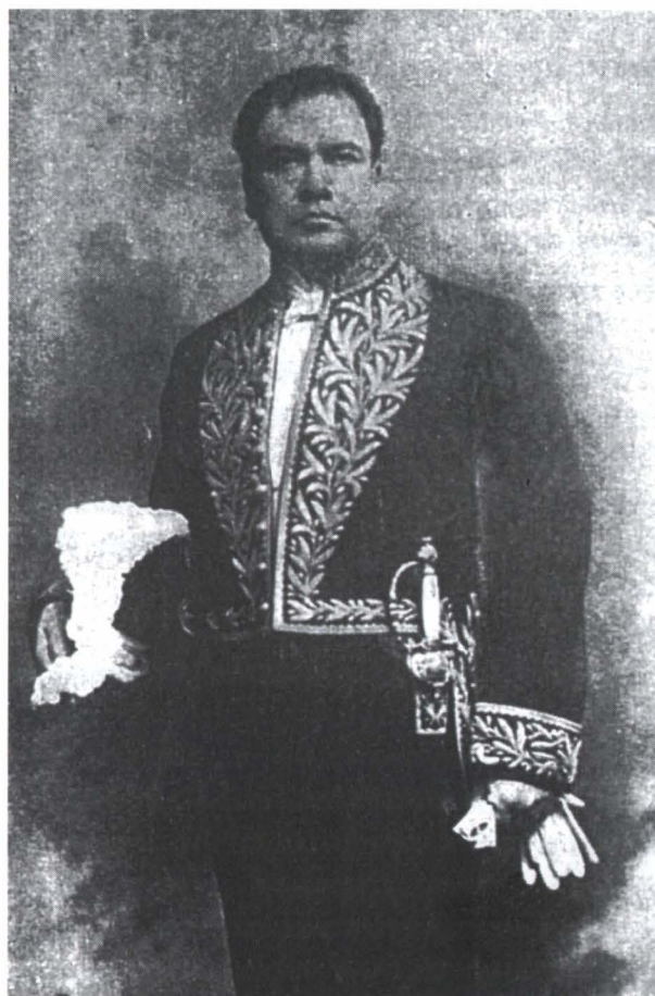
Ministro de Nicaragua en Madrid, «embajador de uniforme alquilado».

Y pone su fe inútil en la nobleza antigua de los bravos caballeros, el primero de ellos Don Quijote. Un cuento suyo, D.Q. , que si se publicó en Buenos Aires en el almanaque Peuser de 1899, debió haber sido escrito en Madrid en 1898, revela la magnitud de esa fe: el abandera-