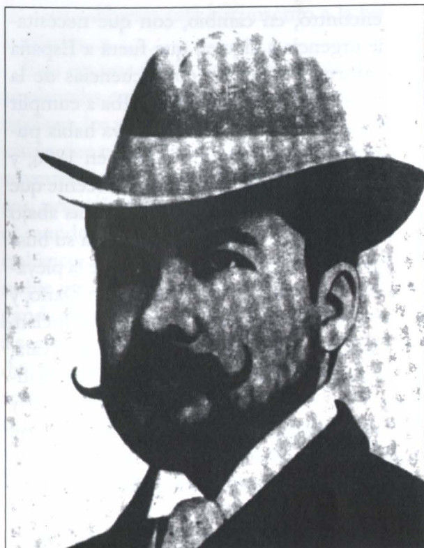
Rubén Darío en 1898.

doles la comida, como en una toma negra de Buñuel; la España popular de los toreros, el Guerra, Algabeño y Machaquito , y el entierro de la sardina en la cuaresma de carnavales, ya la gente olvidándose de la derrota mientras Madrid iba llenándose de más mendigos inválidos de guerra, los repatriados de Cuba y Filipinas recibidos con charanga y alboroto mientras estallaban los motines reprimidos a tiros, toda la España siempre negra de los esperpentos de Valle Inclán que en Luces de Bohemia agregaría a otros dos —él mismo, y Darío— de paseo, bastón en mano, entre las tumbas de un cementerio.