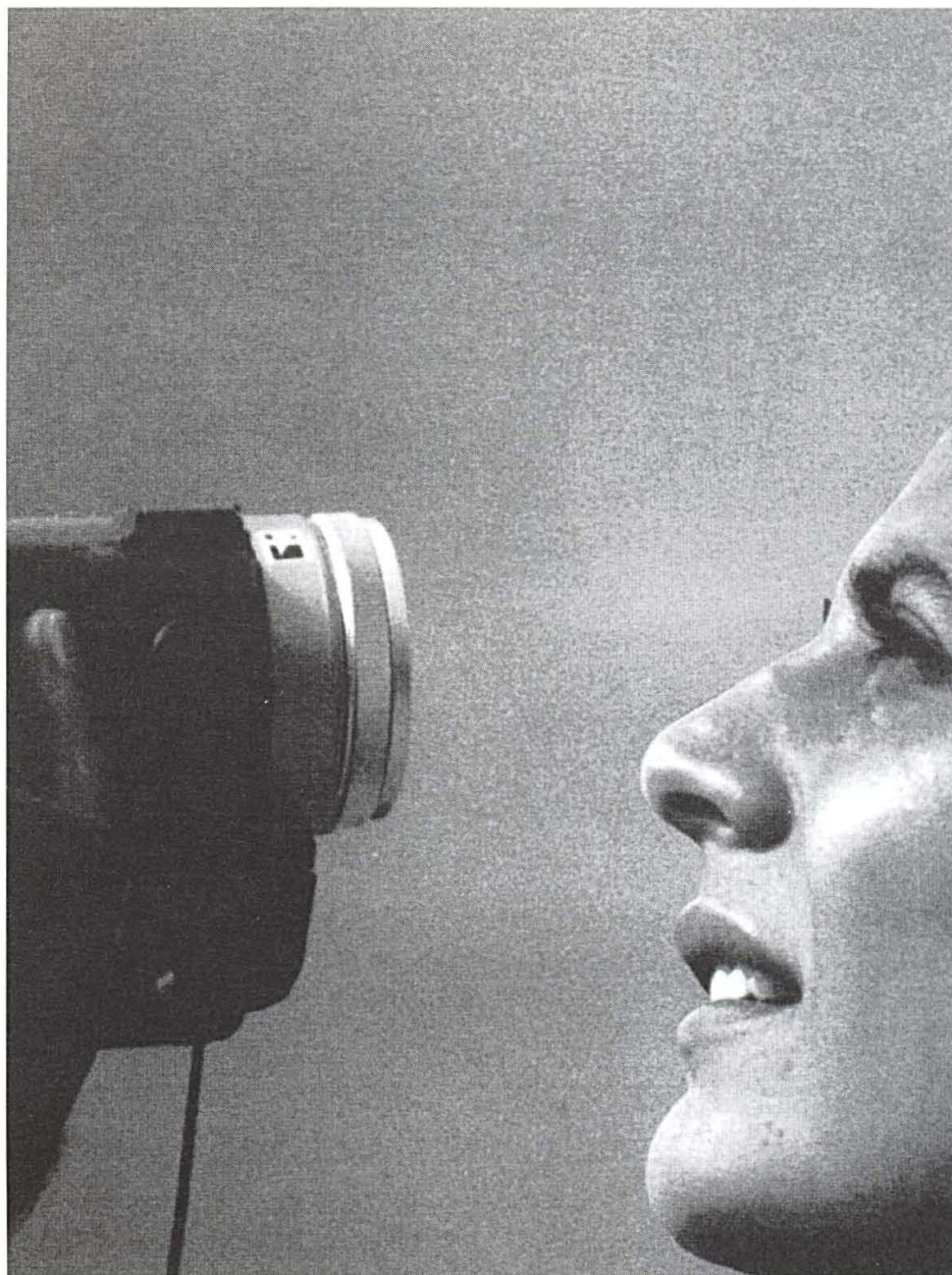
Festivalito 2004, Cine al desnudo

lación al resto de las hiperbólicas salas del fast food cinematográfico, con una sala dedicada a películas en versión original, pues bien, los multicines han caído bajo la picota de la especulación, mientras la Concejalía de Cultura dice que estudia la posibilidad de hacerse con las salas e iniciar un renacimiento cultural que salve a la ciudad de un naufragio anunciado.