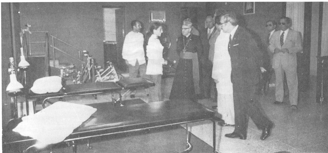
Visita de las primeras autoridades a las instalaciones de la Clínica de Subnormales Profundos, situada junto al Centro de Educación Especial de Monte Coello e inaugurada en el recientemente celebrado Día Universal del Ahorro.

Observación: El presupuesto anual de la D.A.F. girará siempre en torno a una semejante cuantía, de la prevista en la actualidad, limitando la realización de cursos y objetivos concretos mediante un estudio planificador de prioridades. Despertando el interés y la conciencia, creados por Ley y por el Estado el Centro Provincial o Regional de Orientación Escolar y Profesional, la Obra Social de la Entidad en esta línea, cumplidos los objetivos básicos en esta esfera, dejaría paso a otros intereses y motivaciones.