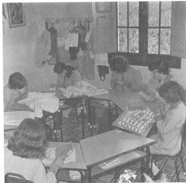
Una de las dependencias del Centro, en donde los pequeños realizan trabajos manuales.