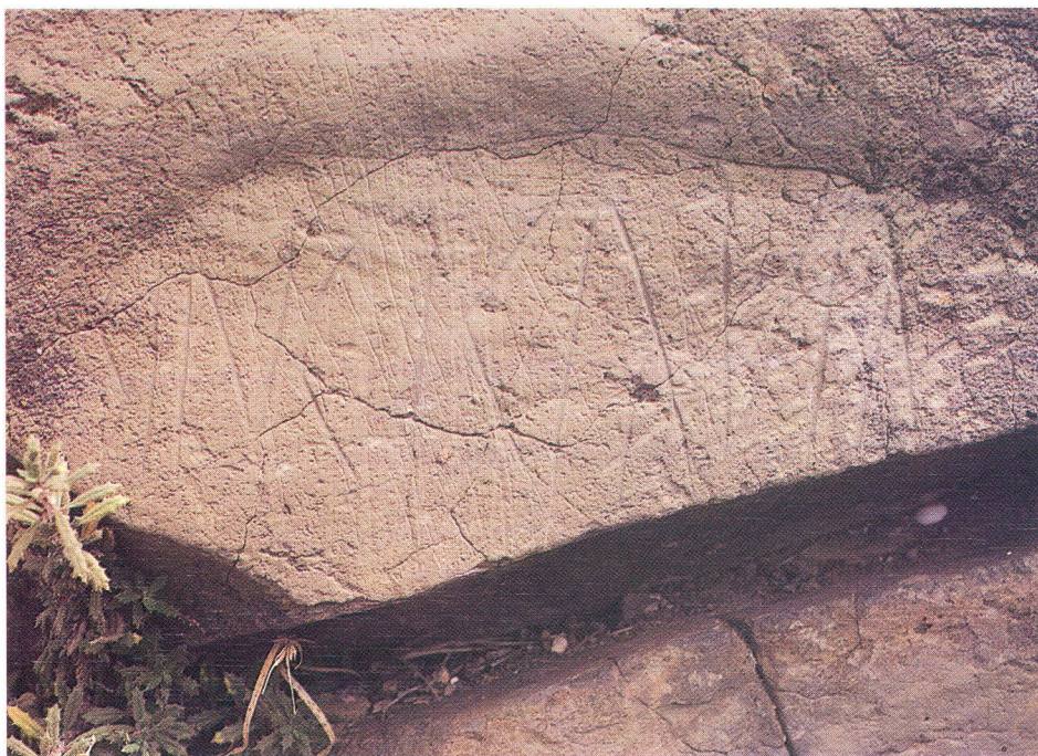
Grabados de la Peña del Letrero (Zonzamas).