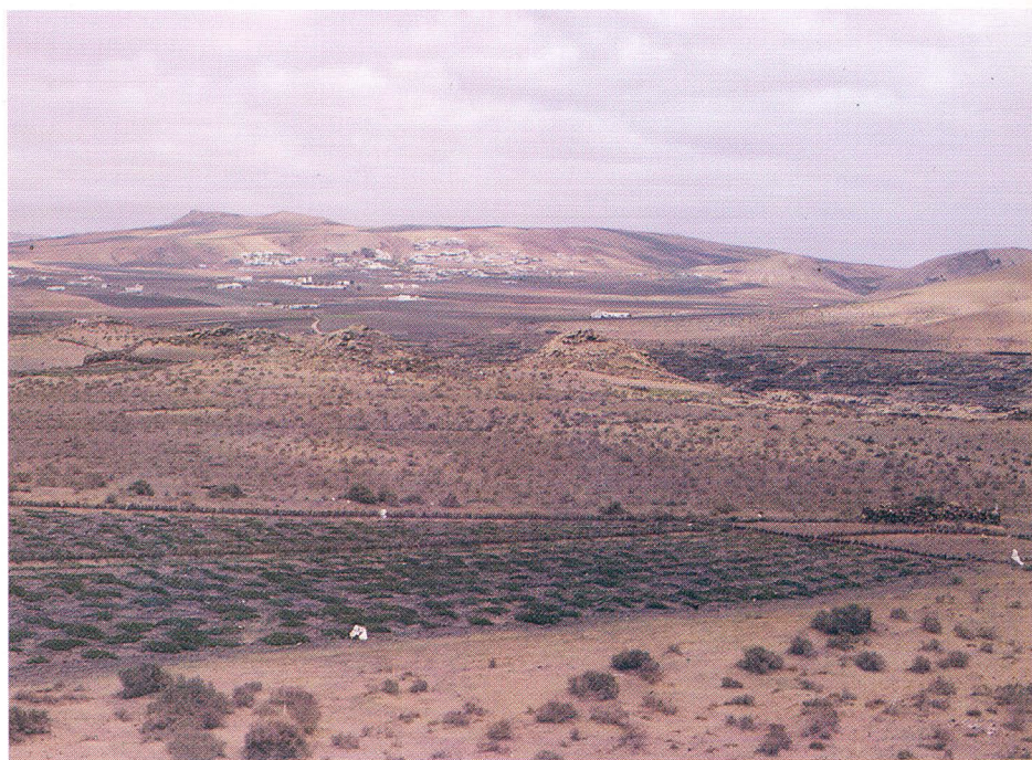
Vista general de la zona de los grabados (Zonzamas).

Por otra parte, está la la leyenda estudiada por el profesor Juan Álvarez Delgado, relativa a la colonización de las