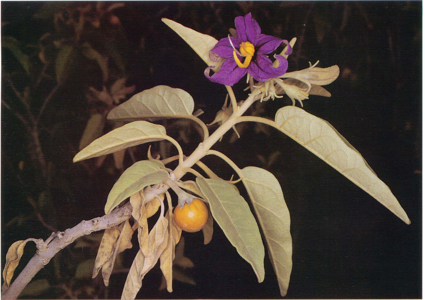
Familia: Solanaceae. Nombre común: Pimentero.