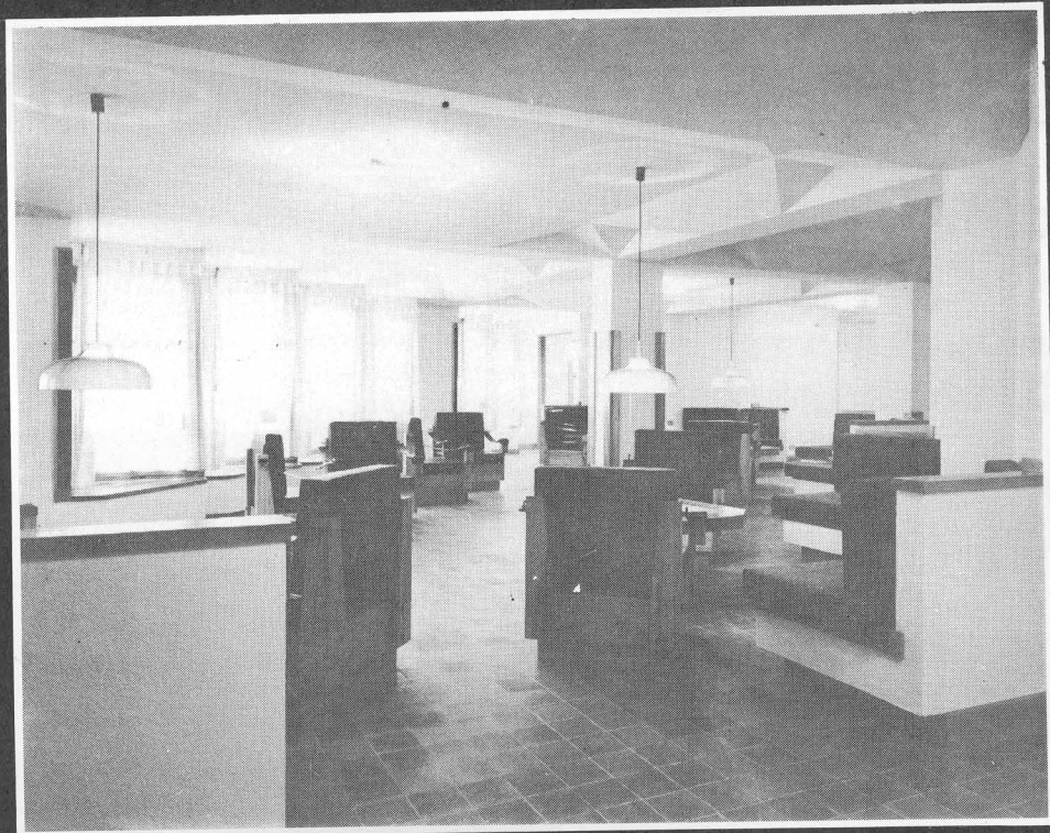
Club de Jubilados de las Chumberas