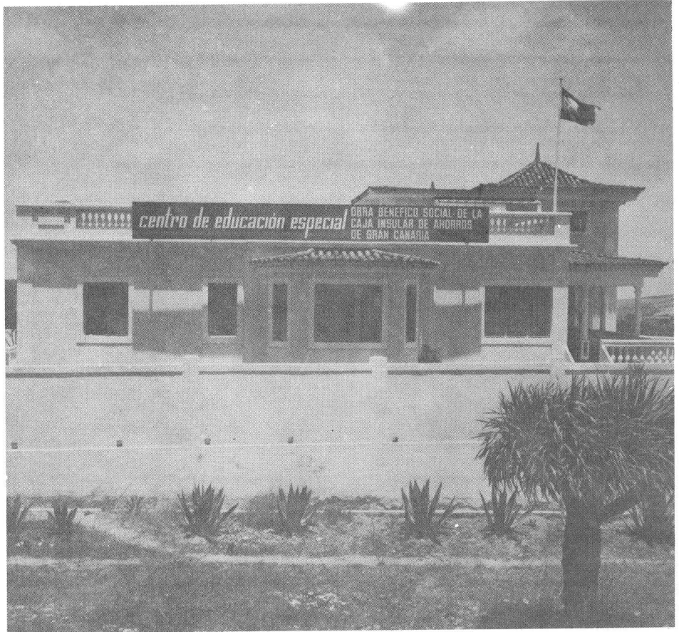
CENTRO EL TOSCON