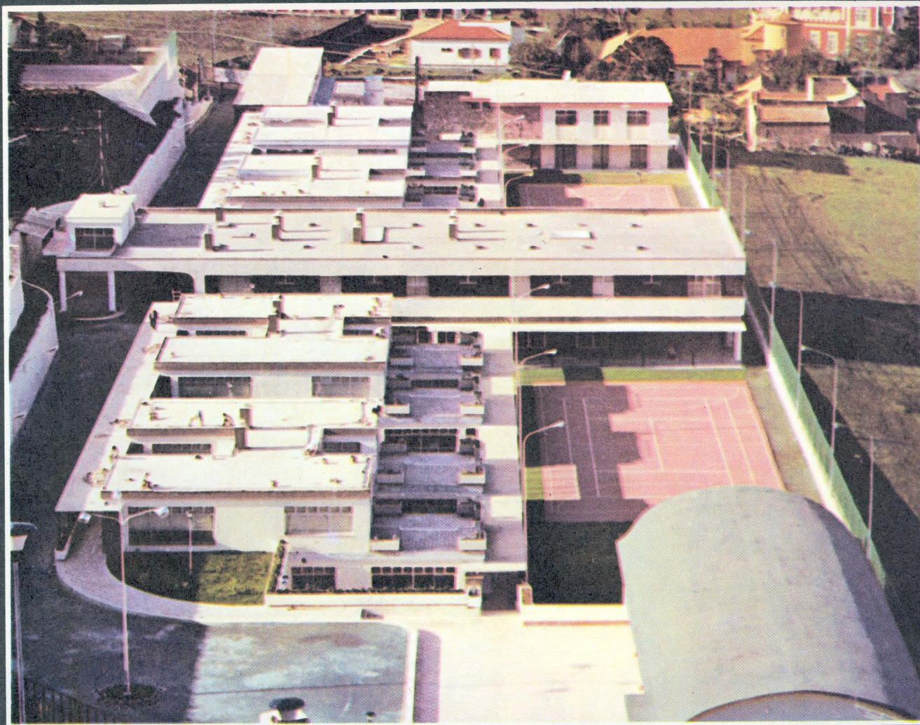
Centro de Educación Especial (Monte Coello)