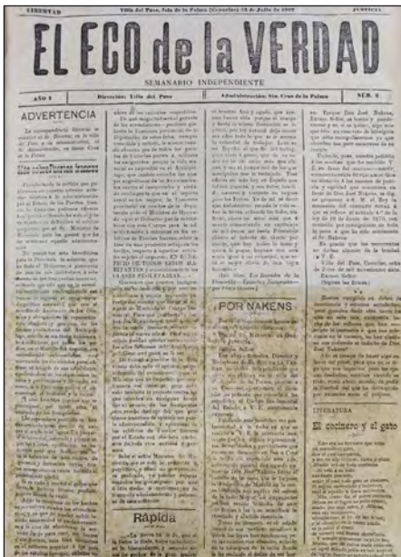
Eco de la verdad (1907-1908)