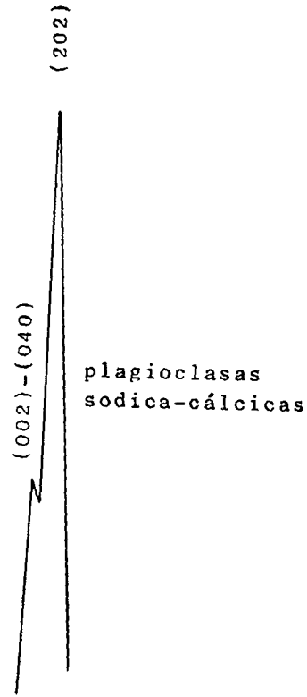
Muestra T-9 basaltos II de los Tilos de Nova (G. C.). Martínez (1982).