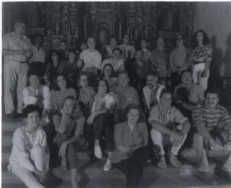
Coral Polifónica Universidad de Las Palmas de Gran Canaria.