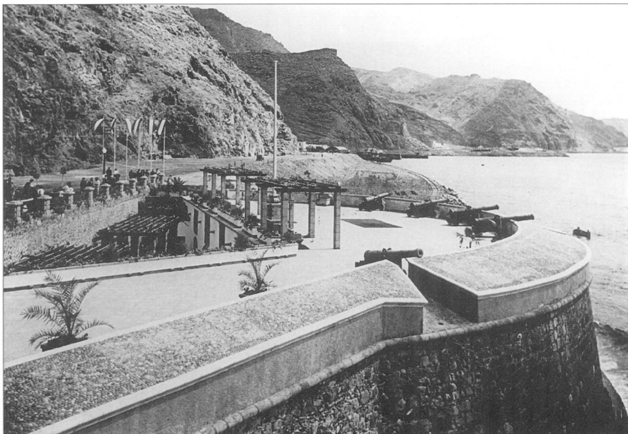
Castillo de Paso-Alto. [Reproducción, Díaz Febles.]