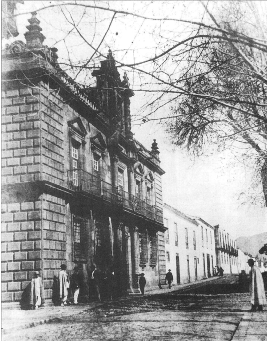
Palacio de Nava.