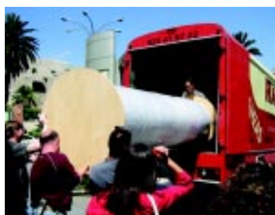
De izquierda a derecha: detalle del estado inicial; daños en el soporte; reverso antes de la restauración; eliminación de antiguos parches; colocación de parches; tratamiento del nuevo soporte; fase previa al reentelado; aplicación de gacha; reentelado; estado del reverso después del reentelado; reintegración cromática; proceso de estucado; desmontaje de la obra para el traslado; enrollado del lienzo; proceso de traslado; colocación definitiva de la obra.