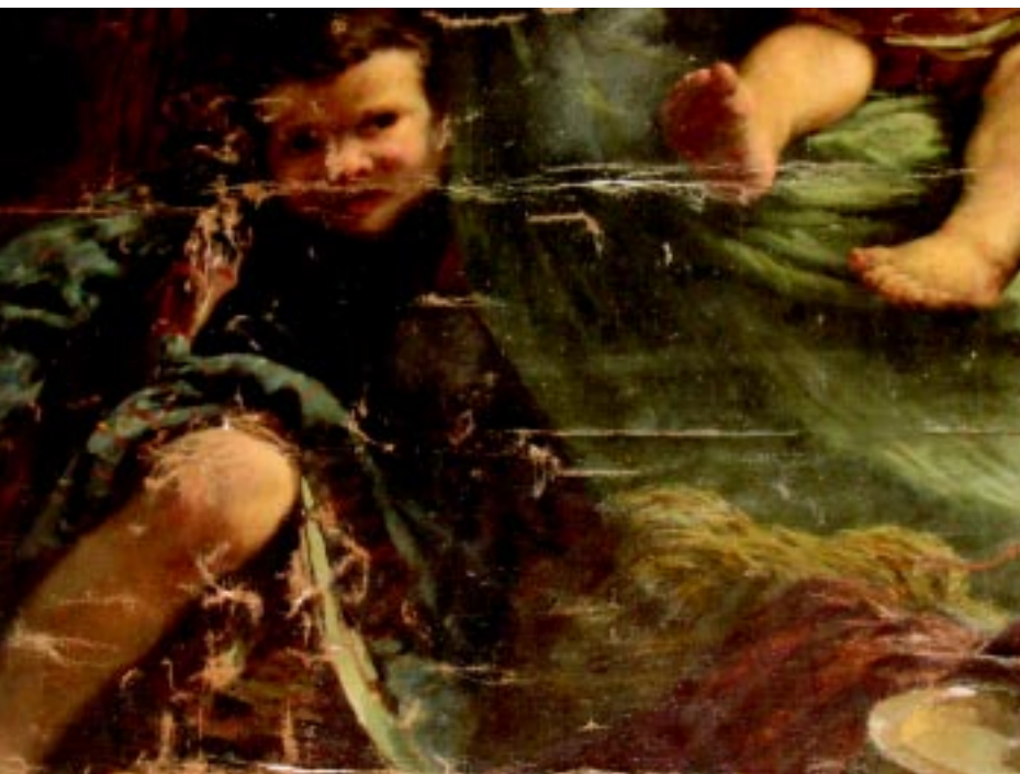
Detalle del lienzo antes de la restauración.

Se trata de un óleo sobre tela de lino natural de densidad media-fina y trama más bien cerrada. Consta de dos partes unidas por una costura. En total mide 335 x 455 cm.