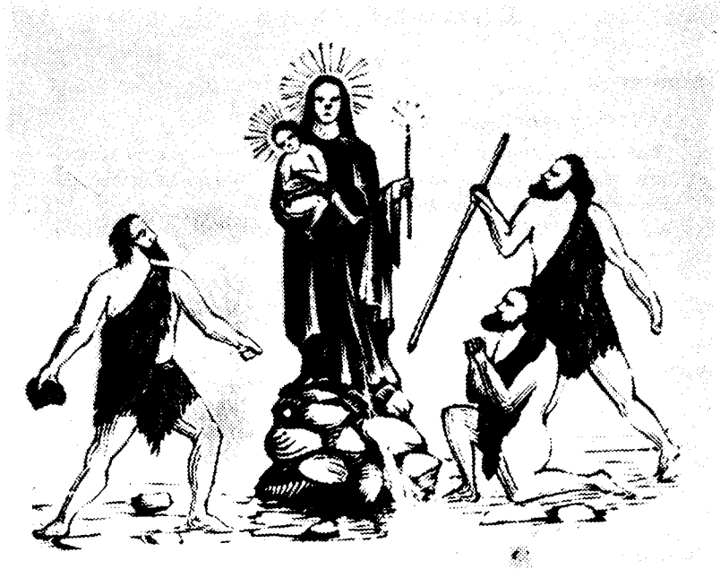
La Virgen de Candelaria adorada por los guanches. (Grabado canario en madera. Siglo XIX. Núm. 46).