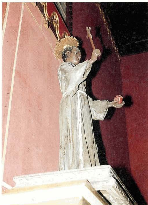
Vista lateral de la imagen de San Benito de Palermo