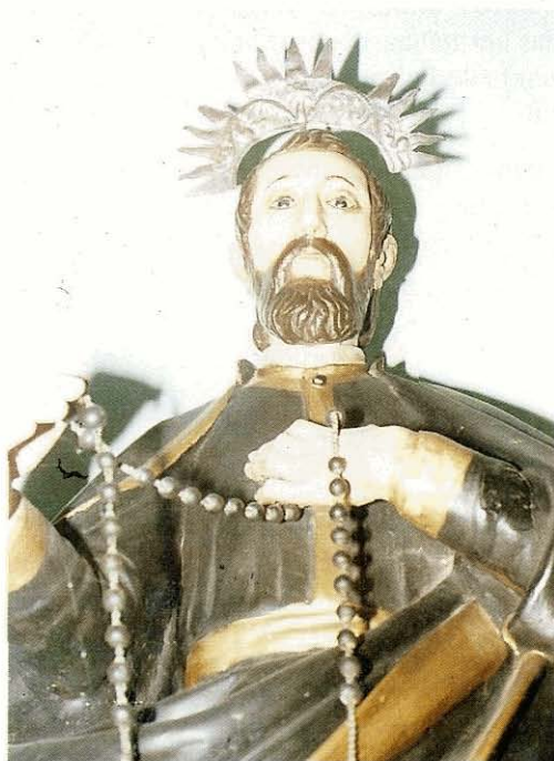
Detalle del Rostro de San Felipe Neri