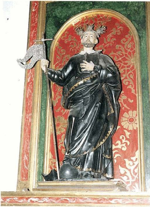
Imagen de San Felipe Neri de Calderón de la Barca (s. XVIII) Iglesia de San Francisco de Las Palmas