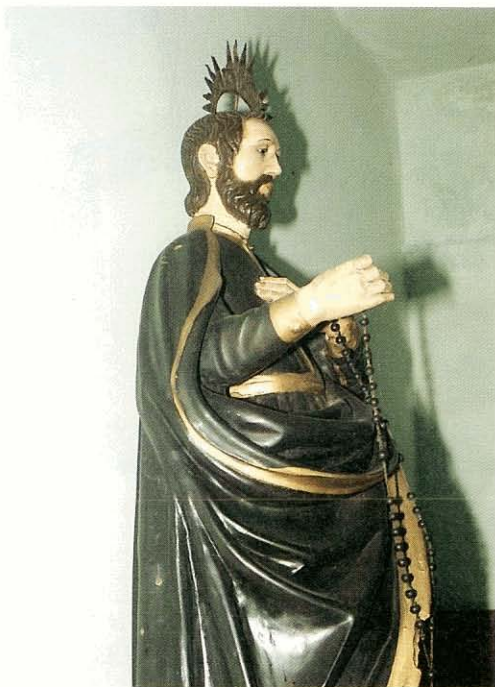
Vista lateral de la imagen de San Felipe (s.XVII)