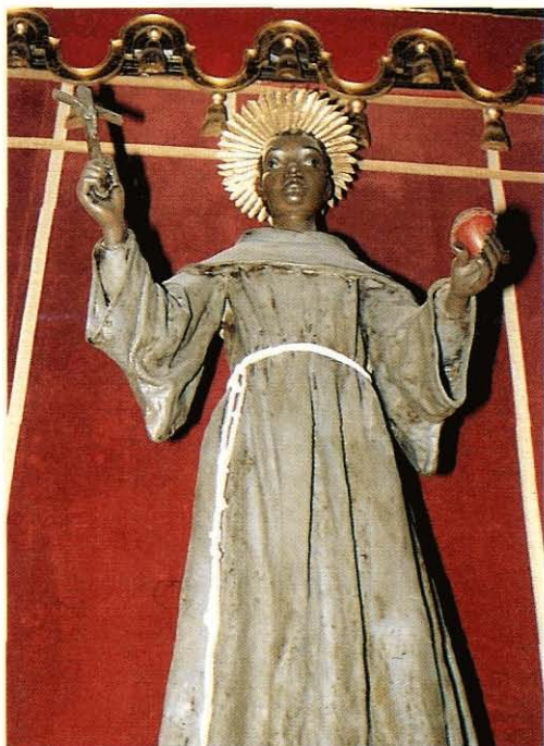
Imagen de San Benito de Palermo. Ermita del Espíritu Santo. Las Palmas

fuera realizada a principios del siglo XVIII. Mayor relación presenta, no obstante, con la obra del también tinerfeño Blas García Ravelo (1618-1680), de cuyo paso por Gran Canaria en 1652 dio noticia la profesora Fraga González (27) . Si analizamos la imagen de San Fernando, atribuida a este autor, perteneciente al antiguo convento