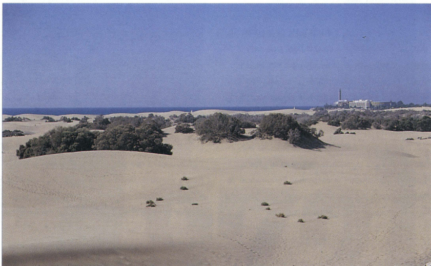
El tránsito indiscriminado a través de las dunas es una de las actividades que mayor impacto ambiental provocan.

reclasificación de los espacios naturales canarios, según ordena la Ley Estatal 4/ 89 de Conservación de los Espacios Naturales y la Flora y Fauna silvestre.