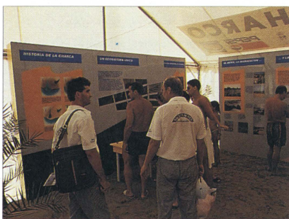
Las actividades de educación ambiental enfocadas a la concienciación de los usuarios de las playas son una parte importante de la labor se ejecuta en las Dunas.

En virtud del Decreto 152/1988, se ordena la confección del Plan Rector de Uso y Gestión del Paraje Natural. Un Avance del citado documento ya se presenta en la reunión de constitución del Patronato en septiembre de 1989. Posteriormente, se inicia la redacción del Anteproyecto de Ley de Espacios Naturales Protegidos de Canarias que propone la