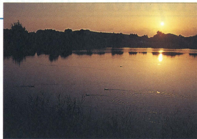
Permitir que todos los ciudadanos de esta isla y los visitantes volvamos a recrearnos observando a la avifauna sedentaria y migrante que vive en la Charca de Maspalomas es el objetivo que se persigue con el Proyecto OASIS "2000".

plantea, entre otras acciones, la construcción de un Centro de Interpretación, donde dar cabida a la gran afluencia de visitantes y donde se ubique información específica relativa a los valores ambientales del espacio natural.