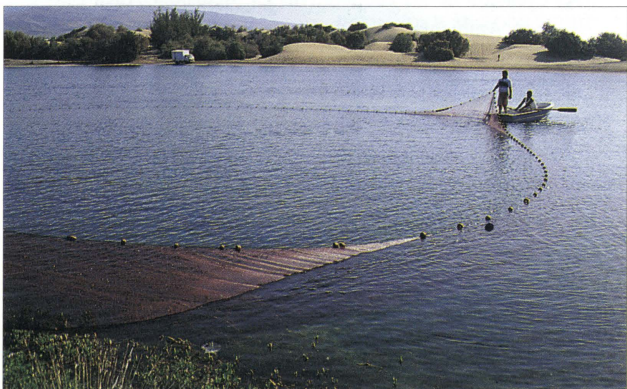
El seguimiento y evaluación de la comunidad ictiológica de la Charca ha permitido detectar hasta diecisiete especies.

Dentro del marco del V Programa Comunitario de política y actuación en materia de medio ambiente y desarrollo sostenible, entre los desafíos y prioridades en materia de medio ambiente se encuentra el desarrollo de una estrategia general de gestión integrada de las zonas costeras para cuya ejecución se cuenta con un instrumento financiero específico, el Programa LIFE (Reglamento -CEE- número 1973/92 por el que se crea un instrumento financiero para el medio ambiente -LIFE-). En este marco, al considerar que las caracte-