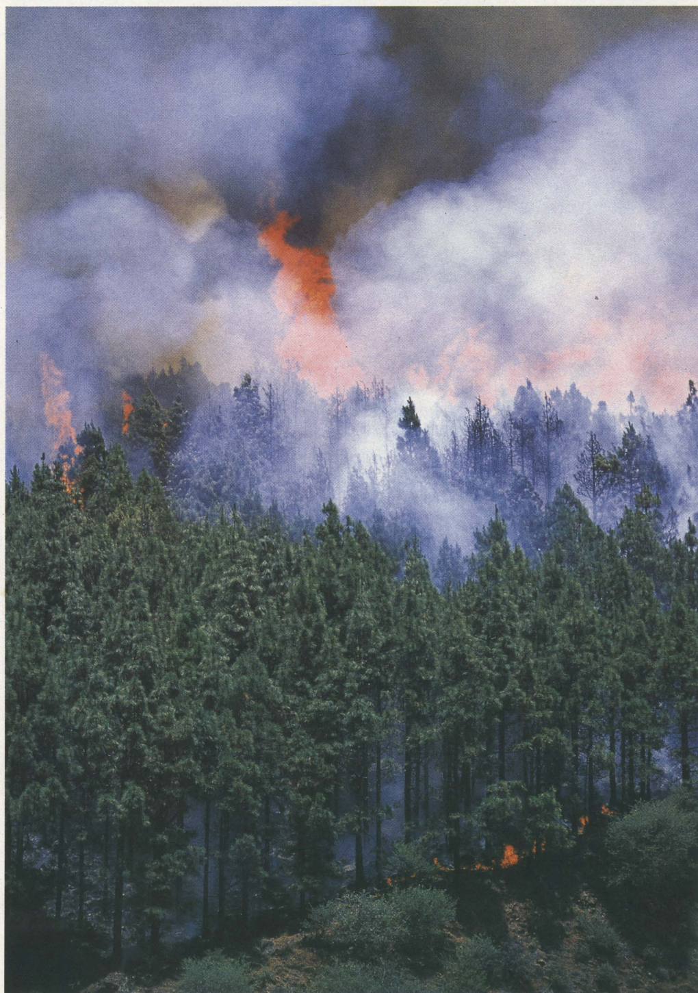
La coordinación entre las administraciones es fundamental para combatir los incendios forestales.

elementos con los que contamos a la hora de combatir un incendio. Nos referimos al personal técnico, a los Agentes de Medio Ambiente y a los trabajadores