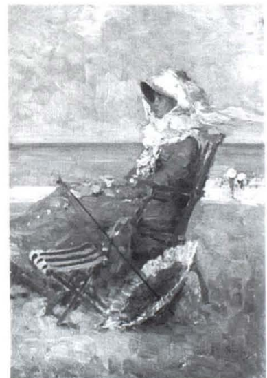
Grigorescu: "Mujer en la playa"

Este brillante panorama se oscurece a partir de 1945 y la literatura rumana entra en barrena. Varias son sus causas. Por un