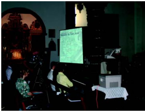
Presentación de la restauración del retablo de San José

El Cuaderno se presentó el 2 de abril en la Biblioteca Insular. Recoge los trabajos del proyecto del Parque Arqueológico de la Cueva Pintada, concebido como una actuación integral, si bien su principal objetivo estaba dirigido a la recuperación de la cámara policromada. En esta publicación se presenta el protocolo diseñado y ensayado en el recinto, útil como ejemplo para mitigar los procesos de deterioro y desarrollar actuaciones de carácter preventivo en bienes patrimoniales.