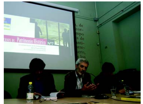
Conferencia: Vírgenes y graneros. Mitos, leyendas y realidades