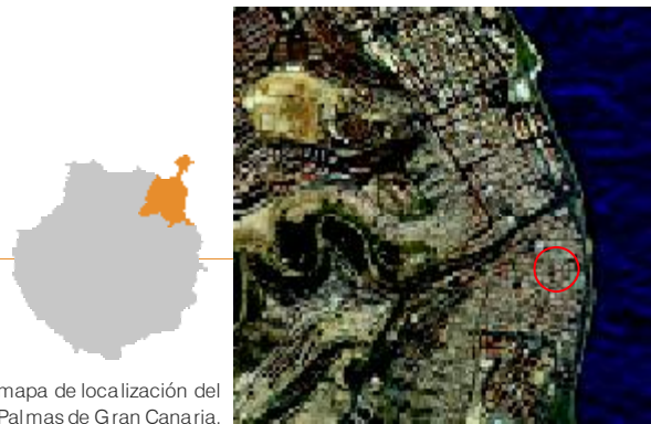
Ortofotografía y mapa de localización del municipio de Las Palmas de Gran Canaria.

“16. Cuartel de Caballería de los Reyes. Situado en la confluencia de las calles Reyes Católicos y García Tello, pertenece en la actualidad al Cabildo Insular de Gran Canaria, cuyas instalaciones han sido adecuadas al Taller Escuela Santa Ana, para alumnos de la construcción. Inmediatamente de ser adquirido por el Estado, el 23 de febrero de 1821, le fue cedido al ejército para sus fuerzas de caballería. Convenientemente restaurado a principios de 1900, se dedicó a oficinas de Caja de Reclutas y Centro de Movilización. Sin pretensiones arquitectónicas, refleja el clasicismo más austero del pasado siglo XIX”.