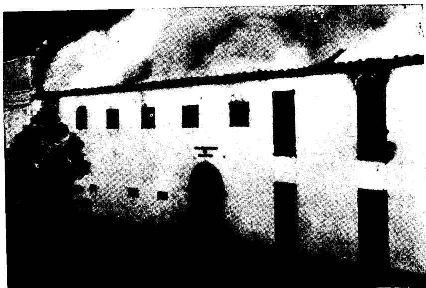
El convento del Realejo, pasto de las llamas, el 21 de febrero de 1952