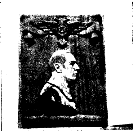
MANOLO RAMOS CABEZA DE CRISTO YACENTE Y OTRAS OBRAS ESCULTÓRICAS