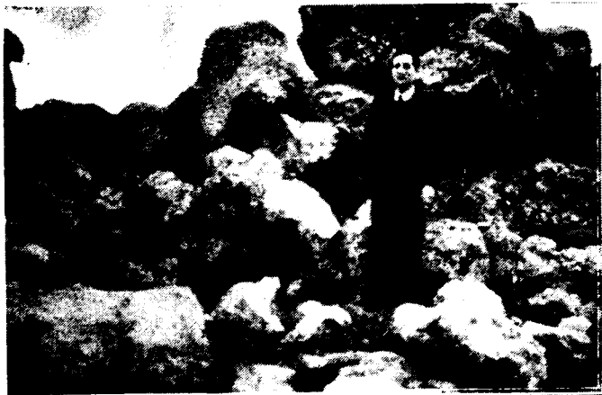
El muro de Zonzamas, todavía imponente, y el monolito grabado.