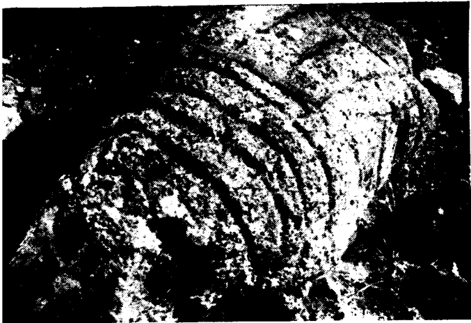
Detalle del monolito grabado, al pié del castillo de Zonzamas, Lanzarote.