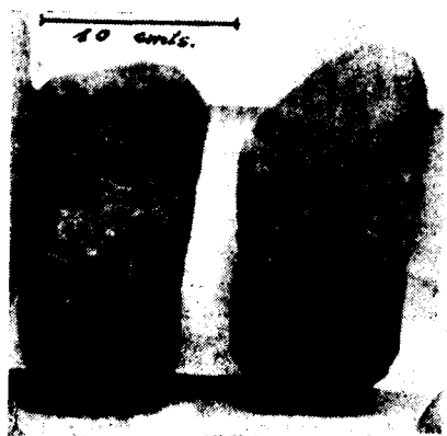
◀ Hachas de piedra halladas en ella.