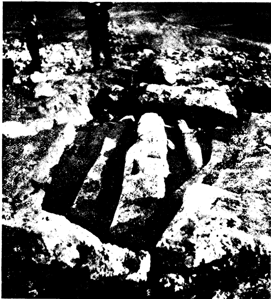
La «Quesera» o «piedra de los majos», en Lanzarote.