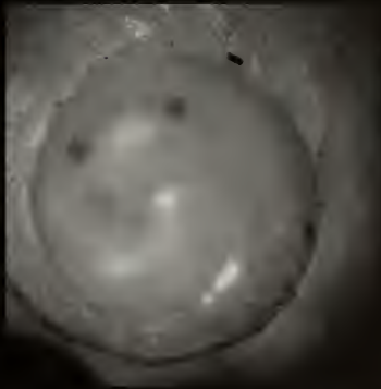
Lámina 2.- Figuras 8-13. Cancellaria pusilla H. Adams, 1869. 8: dibujo de la descripción original; 9: texto de la descripción original; 10-11: sintipo en BMNH; 12: detalle de la abertura; 13: protoconcha.