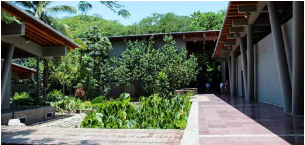
Foto 4. El museo construido por FONATUR a la entrada del sitio arqueológico.

El parque está en manos de FONATUR, que cobra las entradas (60 pesos mexicanos en 2013). En 1991 este parque fue concebido como un parque botánico y zoológico; actualmente es un paseo ecológico: por eso se construyeron andadores empedrados. Pero, inesperadamente, los vestigios arqueológicos resultaron más importantes de lo planeado, por lo que el parque ecológico se ha vuelto parque eco-arqueológico. Hay que reconocer que FONATUR construyó en 2008 un magnífico edificio para el museo, el cual se ha erigido en la entrada del sitio arqueológico en forma de unos cocoteros de monte sosteniendo techos aéreos con troncos de madera tropical.