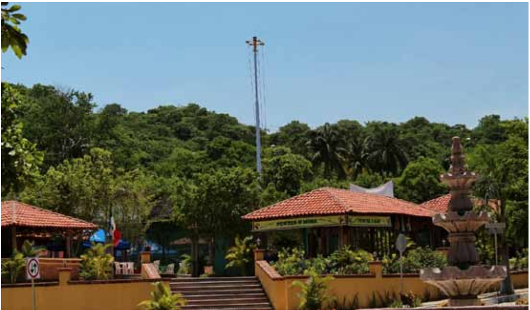
Foto 2. El mástil de los voladores de Papantla en la Plaza del pueblo de La Bocana