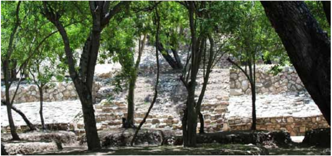
Foto 3. Vestigios de una pirámide en Copalita.