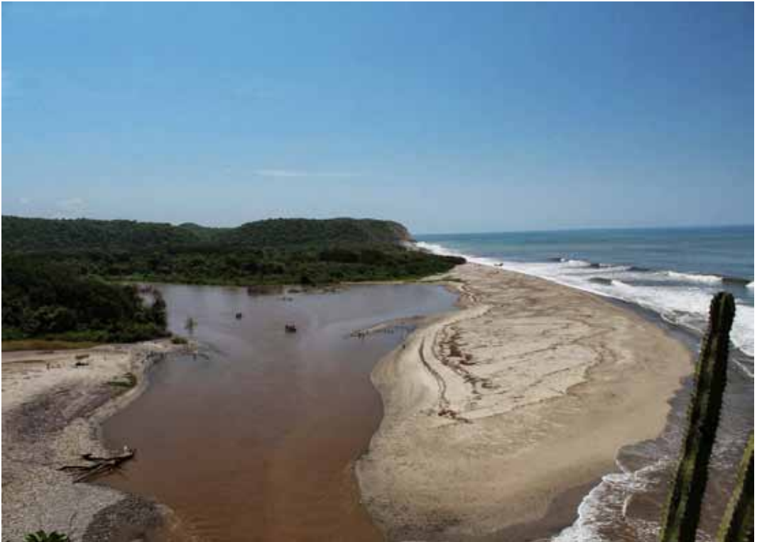
Foto 1. Desembocadura del río Copalita al Pacífico en el sitio La Bocana.

un sitio que carece de la monumentalidad de otros, ya que necesitan de la frecuentación turística para obtener mayores apoyos económicos para realizar su trabajo. Es decir, necesitan generar un discurso ameno y comprensible, pero a la vez históricamente fundado sobre el sitio de referencia y sus recorridos; además necesitan controlar ese discurso para evitar las charlatanerías caricaturescas que enfatizan los sacrificios humanos, tema predilecto del imaginario social sobre México.