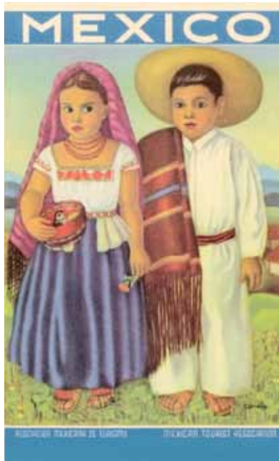
Imagen 3. Vestimenta tradicional.