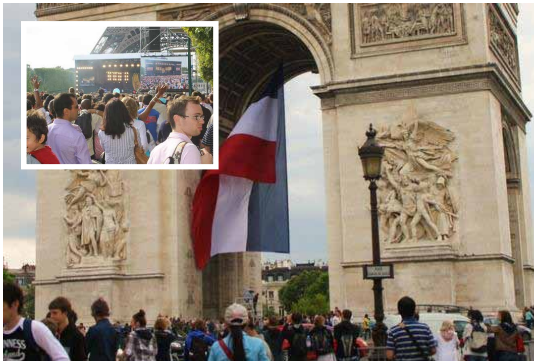
Mosaico 1: Festa Nacional da França. Em destaque os dois monumentos mais representativos.