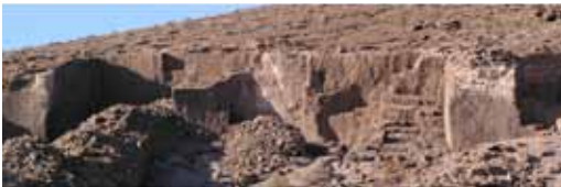
Figura 1. Extracción de lapilli cementados (tobas) en Lanzarote, Canarias.

Las erupciones volcánicas son creadoras de nuevas formas de relieve directas que se desarrollan a la escala humana, por lo que el hombre puede ver el nacimiento, el crecimiento y la formación del volcán con sus lavas, piroclastos y gases. Es aquí donde estriba una de las principales características diferenciadoras del proceso eruptivo en relación con otras formas y tipos de relieve y, por tanto, donde reside el principal atractivo de las manifestaciones volcánicas: la fascinación que produce ver las entrañas de la tierra y su formación en un espectáculo terriblemente bello (Erfurt-Cooper y Cooper, 2010).