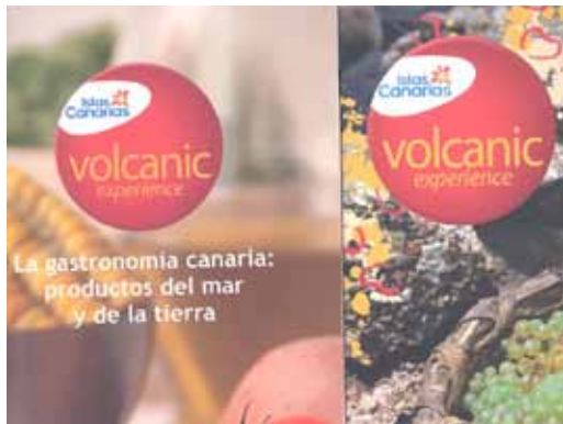
Figura 9. Folletos promocionales de la gastronomía de las islas con el sello de calidad Islas Canarias volcanic experience.

Este hecho pone de manifiesto el doble papel de los volcanes de cara al turismo volcánico. Por un lado un turista más específico (científico) relacionado con las características del propio fenómeno eruptivo (cráteres, conos, lavas, tubos, etc.) y, por otro, unos visitantes con un perfil más amplio, vinculados con un multiproducto relacionado con otros atractivos que ofrecen los paisajes volcánicos isleños (gastronomía, viticultura, paisajes agrarios, cultura, historia, alojamientos, etc.) (Fig. 9), pero que igualmente puede disfrutar de la geodiversidad de los volcanes canarios.