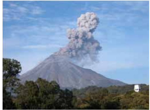
Figura 6. Volcán Colima en erupción. Colima México.

Todo lo expuesto pone de manifiesto la diversidad de atractivos que ofrecen los volcanes, por lo que las razones por las que se visitan los paisajes volcánicos son igualmente variadas (Lopes, 2010). Sin embargo, el éxito del turismo volcánico está relacionado con varios hechos (Erfurt-Cooper y Cooper, 2010): el primero es que el turismo volcánico mantiene conexiones con otros tipos de turismo que se desarrollan sobre los paisajes volcánicos (spas, ecoturismo, turismo de aventura, etc.); la segunda razón es la estrecha conexión del turismo volcánico con los deportes de riesgo y aventura (escalada, esquí, senderismo, etc.) y tercero, con la facilidad de acceder a muchos volcanes lo que provoca un incremento de los geoturistas volcánicos y la cuarta razón está vinculada con el incremento de áreas protegidas en función de sus extraordinarios valores geológicos y geomorfológicos (geoparques).