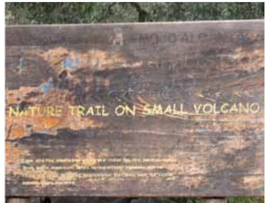
Figura 2. Cartel anunciando senderismo en un volcán (cinder cone), Sicilia, Italia.

visitante de volcanes. En principio la afluencia a las geografías volcánicas no requiere de un público especializado, por lo que el disfrute de los volcanes está dirigido a un público general (Lopes, 2010) y no se requiere de un visitante con altos conocimientos volcánicos debido a la diversidad de recursos turísticos que se adaptan a las necesidades del variado perfil de visitantes (belleza, escenarios, spas, senderismo, etc.). Este hecho, sin duda, garantiza su éxito como espacios y/o destinos turísticos, dado la variedad de recursos que los volcanes ofrecen con posibilidades turísticas.