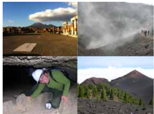
Figura 5. Recursos volcánicos explotados turísticamente: parque culturales (Vesubio, Nápoles), emanaciones de gases (Etna, Sicilia), espeleología (Cueva de San Marcos en Tenerife) y paisajes (rutas de los volcanes en La Palma).

Tal y como hemos señalado, los volcanes disponen de múltiples recursos turísticos que atraen a los visitantes. Es necesario plantearse cuáles son estos atractivos y establecer una clasificación de los mismos. En general, los principales recursos están relacionados con factores geonaturales (relieve, fuentes termales, playas, vegetación, fauna, etc.) y geoculturales (históricos, arqueológicos, religión,