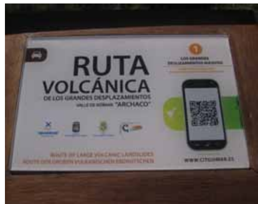
Figura 10. Rutas volcánicas en Tenerife (arriba) y folleto del museo de las Restingolitas en El Hierro (abajo).

realizar un estudio exhaustivo de estos productos, que si ha sido recogido en trabajos previos (Dóniz-Páez, 2012), pero se ha intentado que aparezcan los más significativos y emblemáticos de Canarias. En este sentido, se han seleccionado diez productos referidos a las islas de El Hierro, La Palma, Tenerife, Gran Canaria, Fuerteventura y Lanzarote (Tabla 2). De entre todos estos ellos, destacan las rutas volcánicas en Tenerife y el museo de las restingolitas en el pueblo de La Restinga en el municipio de El Pinar en El Hierro, dado su carácter simbólico y emblemático relacionado con la última erupción de carácter submarino que ha tenido lugar en la isla entre 2011-2012 (Fig. 10).