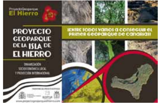
Figura 3. Cartel del proyecto de geoparque de la isla de El Hierro