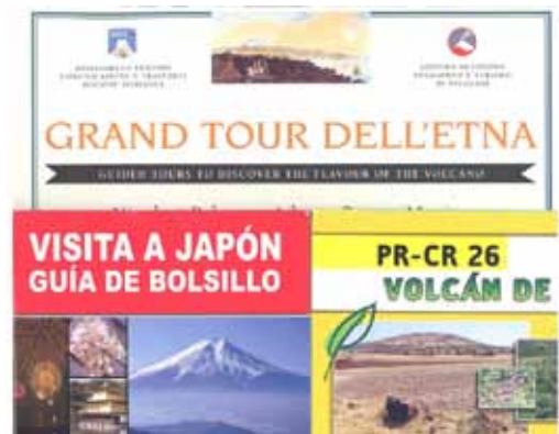
Figura 4. Diferentes folletos turísticos donde se promocionan los volcanes.

Tal y como se ha comentado, una de las razones del éxito del turismo volcánico está en que acapara una amplia gama de perfiles de visitantes. Ahora bien, dado la propia definición del turismo volcánico, es cierto que se pueden plantear productos turísticos orientados hacia visitantes más especializados, con un alto conocimiento del fenómeno eruptivo sin que haya conflicto alguno entre unos y otros turistas (Fig. 4). Tanto en un caso como en el otro, el incremento de los visitantes a las zonas volcánicas por motivos turísticos depende de varios factores: el estado activo o no de los volcanes, la facilidad de acceso a los mismos, el tipo de clima, el transporte y la distancia a recorrer, el coste adicional para transportar equipamientos, etc. (Erfurt-Cooper y Cooper, 2010).