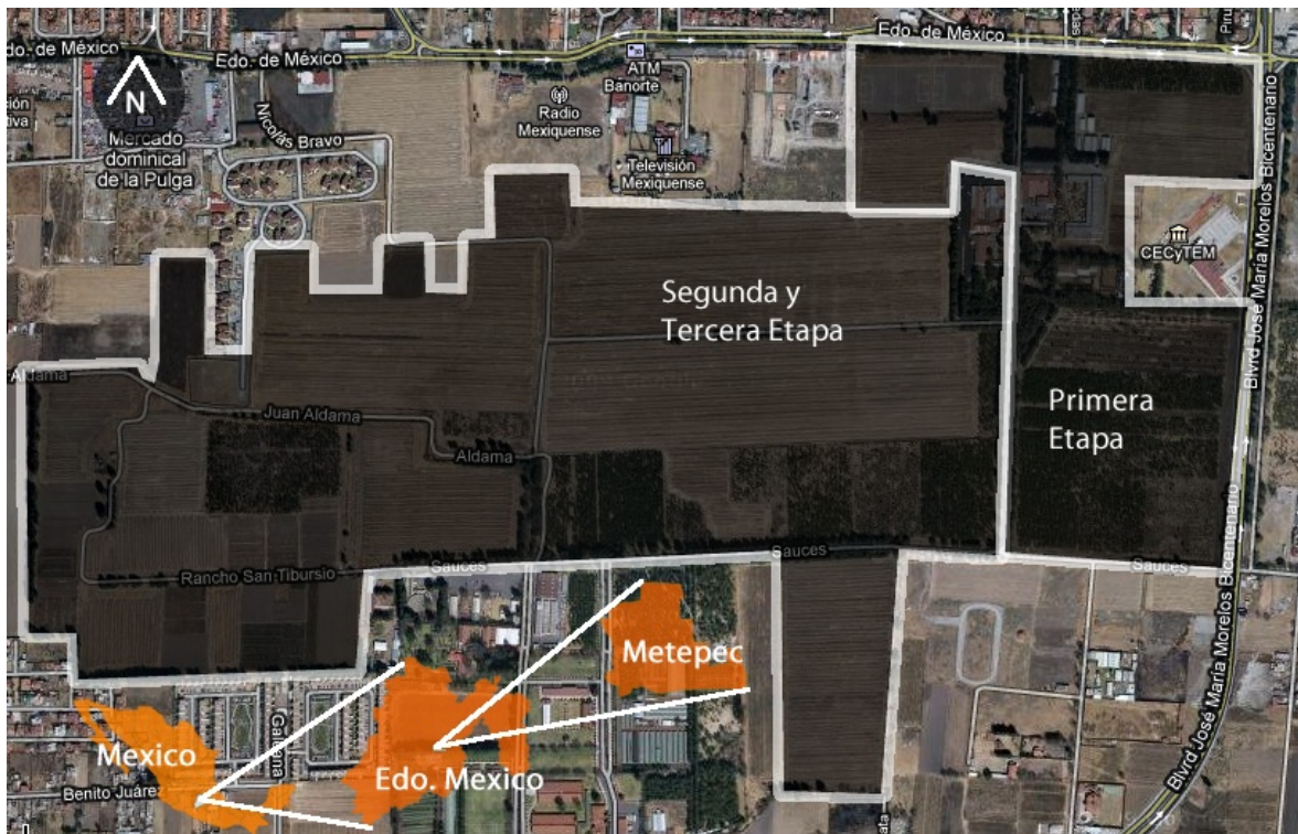
Figura 1. Mapa que indica la ubicación del Parque Ambiental Bicentenario.

Por lo tanto, y considerando las recomendaciones de Oguz (2001) y Chiesura (2004), se diseñó una encuesta dirigida a visitantes del parque de 15 años en adelante, y que acostumbren visitar el parque. El objetivo de la encuesta fue: conocer el perfil socioeconómico de los visitantes (sexo, ingreso mensual familiar, lugar de residencia,