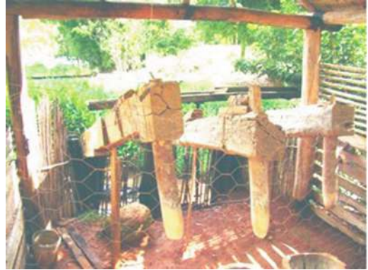
Imagem 2 – Monjolos do Rancho Tomaz no NTBC Galdinos, município de Fervedouro – MG, Brasil

Os atrativos ligados à produção associada ao turismo encontram-se bem representados, devido aos meios artesanais de produção aliado à diversidade culinária e aos valores qualitativos desta produção. Estes meios estão ligados a presença de monjolos, alambiques e engenhocas sendo utilizados como atrativos turísticos, (Figura 2). Este fato vem aumentando e influenciando positivamente na comercialização dos produtos da família agricultora. Isso justifica trabalhá-los, agregando valor à produção associada ao turismo através de uma relação com o parâmetro cultura .